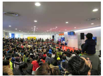
大人気のウルトラマンショー