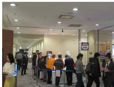
鹿児島黒牛に長蛇の列