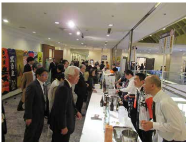
焼酎コーナーも大人気

焼酎コーナーは、終了前にすべて在庫が無くなる大盛況ぶりで、ステージや抽選会も大いに盛り上がりました。