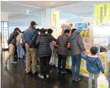
鹿児島県ブースの様子

県大阪事務所も観光ブースを設置し、大河ドラマ「西郷どん」や明治維新150周年など鹿児島の観光についてPRや観光案内を行い、関西から鹿児島へ旅行に行く際、便利な神戸空港の利用を呼びかけました。