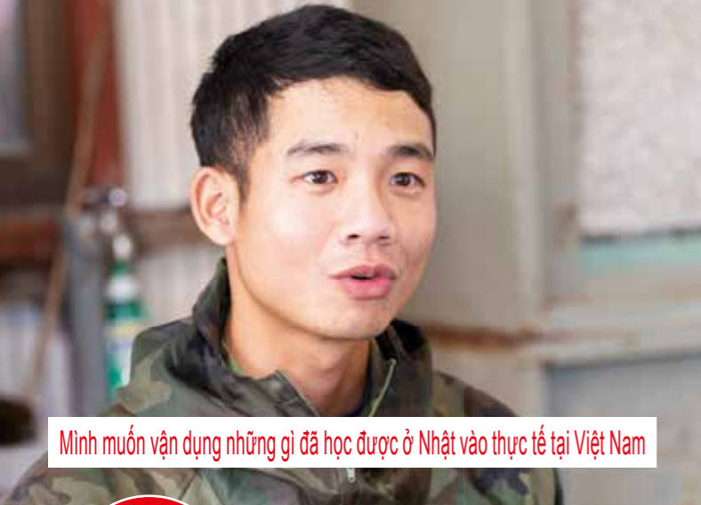
Minh muốn vận dụng những gì đã học được ở Nhật vào thực tế tại Việt Nam