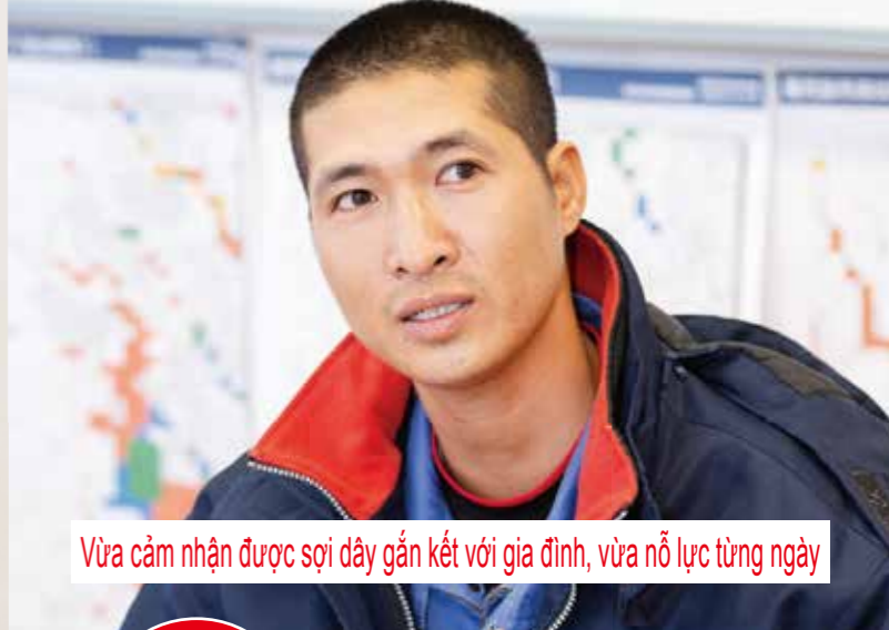
Vừa cảm nhận được sợi dây gắn kết với gia đình, vừa nỗ lực từng ngày