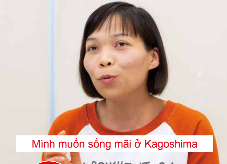
Minh muốn sống mãi ở Kagoshima