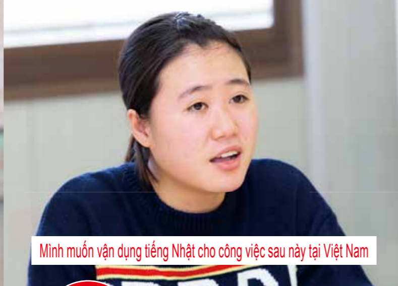
Minh muốn vận dụng tiếng Nhật cho công việc sau này tại Việt Nam