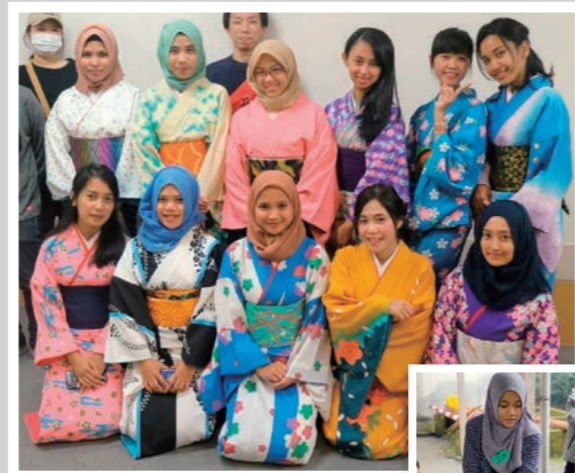
着物の着付けや餅つきなど日本の文化に触れる機会もあります。