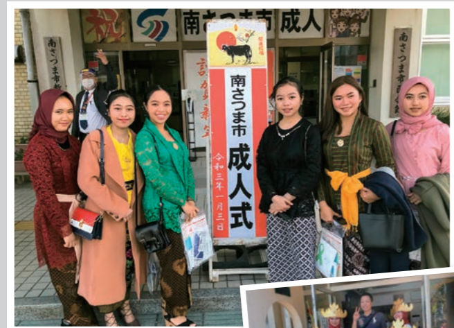
成人式や敬老会への参加など、地域との交流が盛んです。