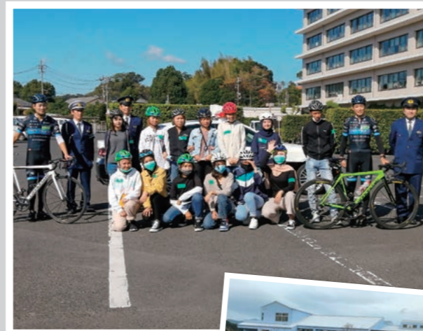
日本の交通ルールを勉強する自転車教室も開かれています。