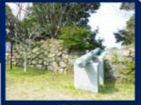
<住所> 肝臓郡南大隅町根占辺608-1

鹿児島湾防衛のために沿岸に設置された砲台のひとつ。1862年の生麦事件の後、イギリス艦隊の到来に備えて拡幅工事が行われましたが、実際にここから発射することはありませんでした。現在は2ヶ所の砲門部分が残っています。