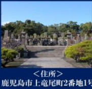
<住所> 鹿児島市上竜尾町2番地1号

西南戦争における西郷軍の戦死者が埋葬されています。墓地の中央部に、西郷隆盛の墓があり、取り囲むように村田新八、桐野利秋、篠原国幹、別府晋介、桂久武などの墓も立っています。(南洲神社・西郷南洲顕彰館も併設)