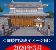
<御楼門完成イメージ図> 2020年3月 完成予定

かつて鶴丸城の正面中央には、御楼門がありました。明治6年(1873年)の火災で焼失しました。 現在、県と鶴丸城御楼門復元実行委員会で構成する「鶴丸城御楼門建設協議会」において、2020年3月の完成を目標に、御楼門の建設に取り組んでいます。