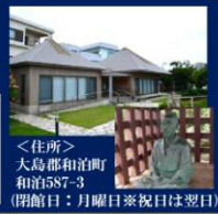
<住所> 大島郡和泊町 和泊587-3 (閉館日：月曜日祭日は翌日)

西郷隆盛の沖永良部島滞在時の様子を知ることができます。敷地内には、西郷が初めてに入った雨風吹き付ける2坪ほどの大きさの牢が再現されています。西郷はこの地で「敬天愛人」の思想を確立したといわれています。