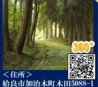
<住所> 始良市加治木町木田5088-1

江戸時代に整備された薩摩街道・大口筋の一部。山の中に石畳の道が続きます。西南戦争の際は、西郷軍がこの坂道を通って熊本へ向かいました。大河ドラマの撮影地としても有名です。