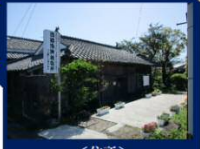
<住所> 肝臓郡南大隅町根占北38

西郷隆盛が大隅での狩猟の際に宿泊した家。ここで西南戦争のきっかけとなる火薬庫襲撃事件を知ります。この家では、西郷隆盛の猟銃が暴発した時の弾痕跡や手水鉢、石風呂等が当時のまま残っています。