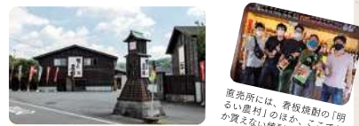
販売所には、着抜焼酎の「明るい唐村」のほか、ここでもか買えない焼酎もたくさん。