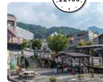
至る所で温泉の蒸気がもくもくと湧く霧島温泉郷。霧島温泉市場にはお土産ショップや食事処が集まる。