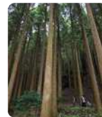
霧島ホテルの敷地内にある「百年杉庭園」でマイナスイオンたっぷり森林浴。

最終日は終日フリータイム。温泉街の街歩きや湯めぐり、霧島市外の名所に足を伸ばすのもよし。県内には約100の温泉地、「維新ふるさと館」をはじめとした明治維新ゆかりの地、南九州最大の繁華街「天文館」など、訪れるべきスポットは数知れず。