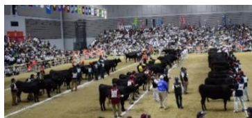
第11回宮城大会の様子