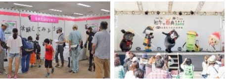
第11回宮城大会の様子