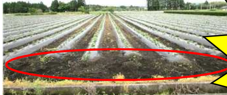
③ 枕畝を設置しない