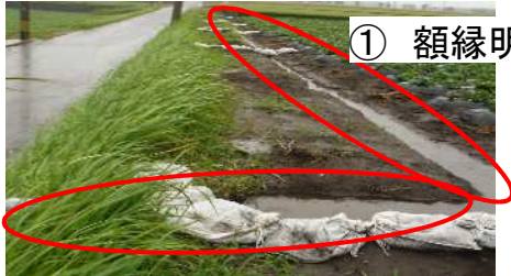
① 額縁明きよの施工

基腐病菌は水を介して移動するため、水が溜まりやすいほ場で感染株が増加します。感染してからでは被害を抑えることが難しくなるため、以下の3つの作業を行い、ほ場に水が溜まらないようにしましょう。