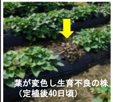
葉が変色し生育不良の株 (定植後40日頃)