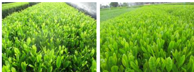
図1 「せいめい」(左)と「さえあかり」