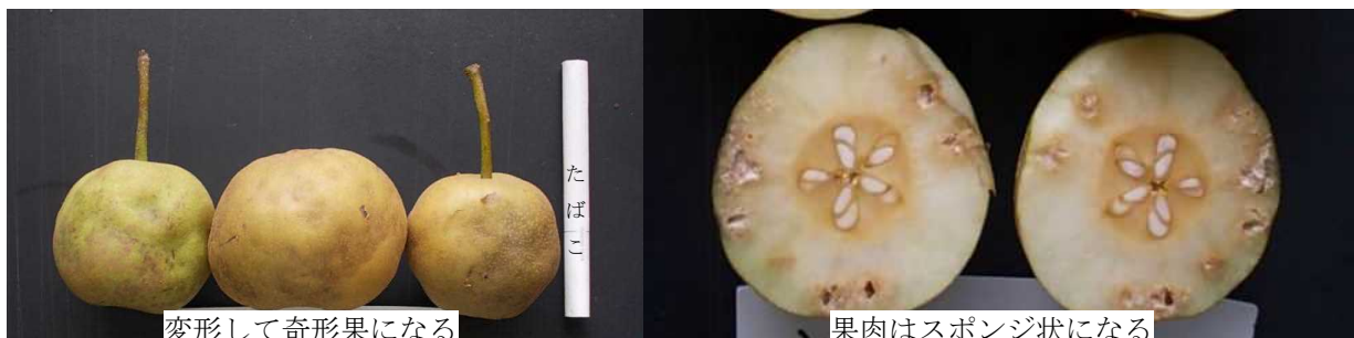
図2 カメムシ類によるナシ幼果の被害