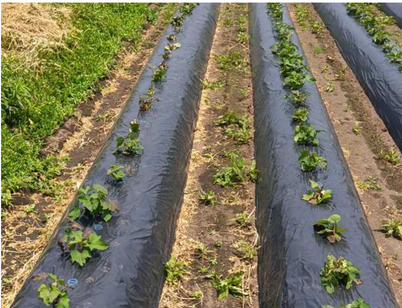
図1 サツマイモほ場外縁の畝での被害状況 （令和8年5月8日撮影）