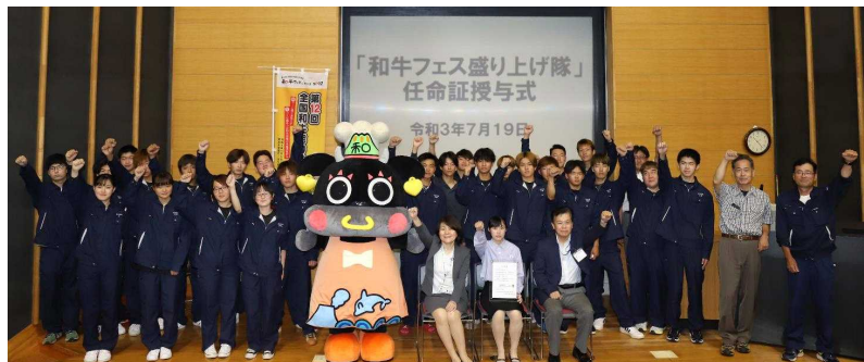
任命証授与式（令和3年7月19日農大講堂にて）