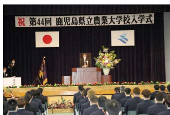
出席者を絞って2年ぶりに開催した入学式(4/8)