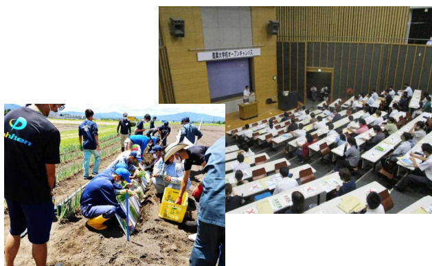
年3回開催予定だったオープンキャンパスも1回のみ(8/4)