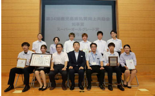
授与式後の記念撮影

併せて、組合乳質格差基準のオールAランク以上を満たした者に授与されるスーパーオールグレード賞にも輝きました。なお、授与式は令和3年7月15日、農大講堂で行われました。