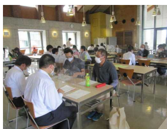
多様な農業法人等が参加した就農・就業相談会(7/21)