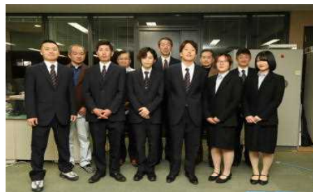
ヤンマー学生懸賞論文・作文 コンクール受賞者と関係者の面々