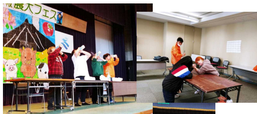
コロナに負けるな！皆で楽しんだ農大フェスタ（12/2）