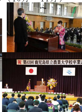
暖流桜の咲く青空の下での卒業式（3/9）