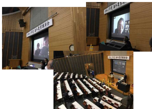
アメリカ、東京とオンラインで結んで実施した海外農業講演会（1/7）