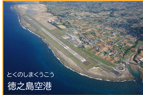
とくのしまくうこう 徳之島空港