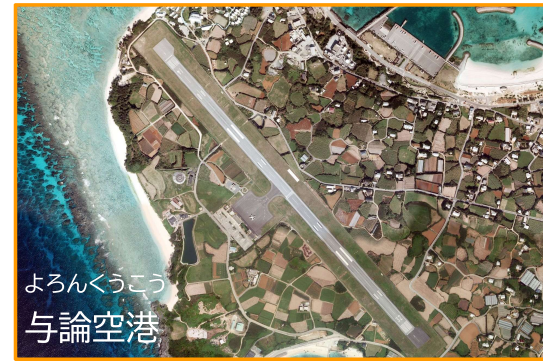
よろんくうこう 与論空港