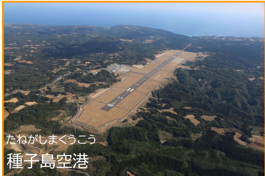
たねがしまくうこう 種子島空港