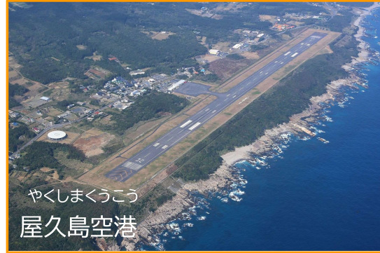
やくしまくうこう 屋久島空港