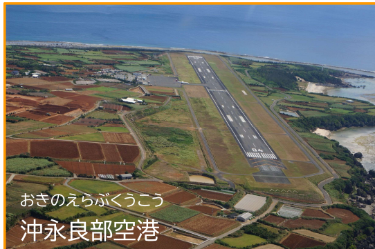
おきのえらぶくうこう 沖永良部空港