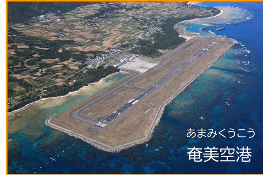
あまみくうこう 奄美空港