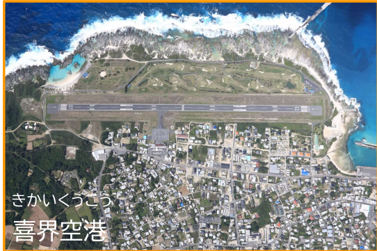
きかいくうこう 喜界空港