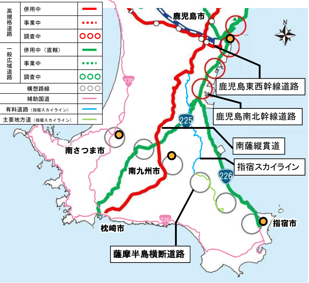
【出典】九州地方新広域道路交通計画(令和3年7月策定)に、一部加筆