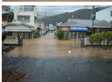
仲里川 出水状況 (2日 9:30頃)