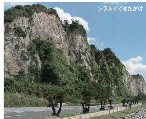
※シラスなどが分布していない場所でも、さまざまな条件により、土砂災害が起きています。