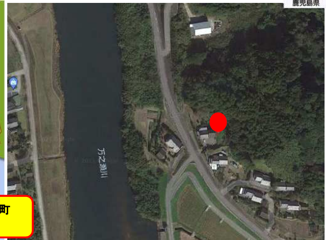
南九州市川辺町 田部田地区