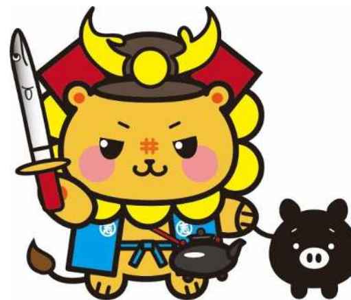
志布志市公認キャラクター（志武士ししまる&トン助）