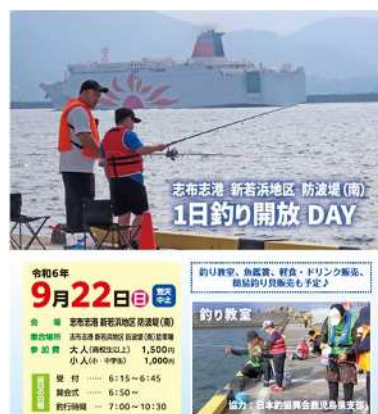
参加親子による 開会宣言