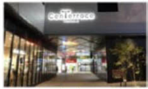
質の高いデザインの例 1