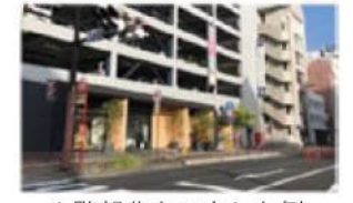
1階部分を工夫した例