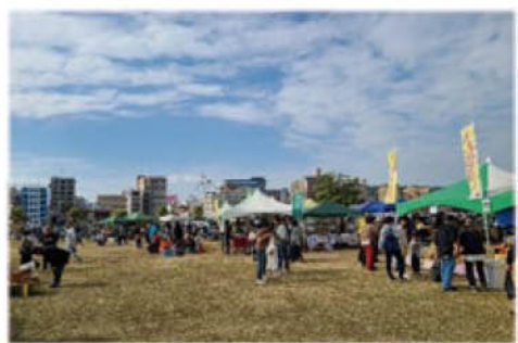
□④朝日通りを望む東屋(あずまや)付近 ウォーターフロントパークにおける活動の風景