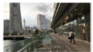
デッキの活用の例