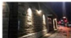
歴史的建造物の演出例