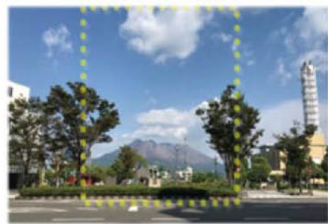
○③みなと大通りと県道との交差点付近 ※黄色点線内は、桜島への見通しを確保する範囲