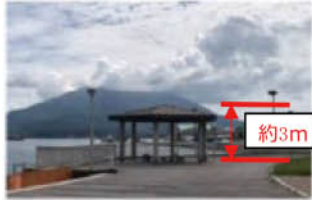
ウォーターフロントパーク東屋や樹木の高さ