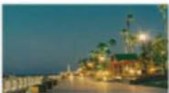
通りの夜間景観の例