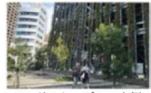
ランドスケープの工夫例

駐車場・駐輪施設の設置にあたっては、樹木や花壇などによるバッファゾーンの設置等、ランドスケープを工夫することにより、歩いて楽しめる様な空間となるよう努めます。