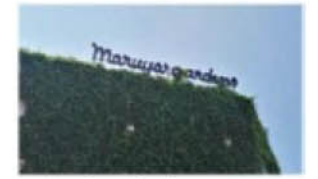
質の高いデザインの例 2