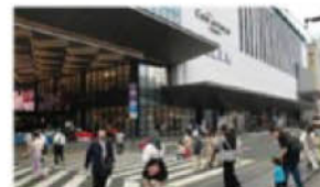
セミパブリック空間の例