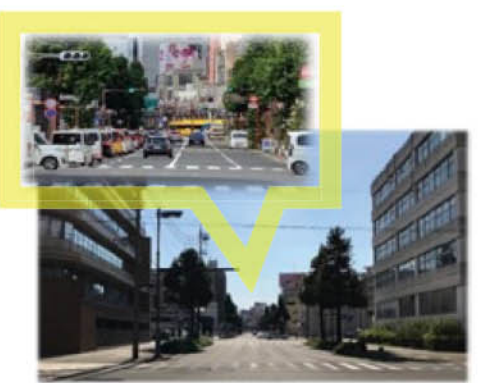
□⑧ドルフィンポート跡地付近(マイアミ通り) 立ち並ぶビルの間に見える市街地を行き交う路面電車やバスの風景