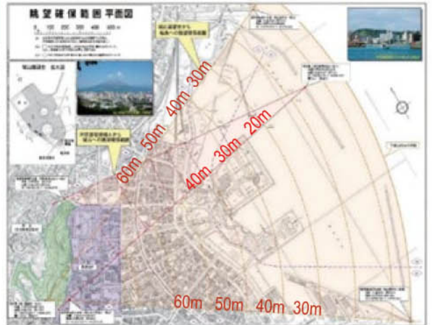
桜島・城山への眺望確保範囲(鹿児島市景観計画に加筆)