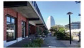
低層階工夫で圧迫感の軽減例