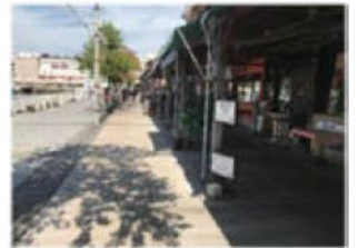
外部と内部空間の連続性の例