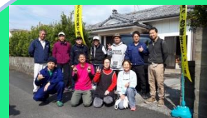
（新しい出会い・仲間が増えました）