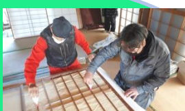
（10枚の障子張替えを実施）