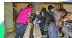
（専門工具を使用してのDIY）