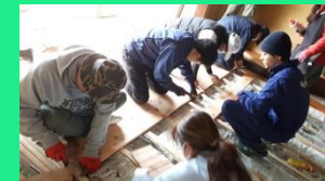
（4畳半、2部屋の張替えに挑戦）