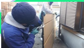
（錆びた戸車の取替え作業を実施）