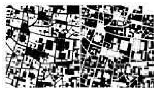
図3 イタリアの都市の白黒反転

（壺を認知するか顔を認知するか。一方が「図」と知覚されると他方は「地」となり知覚されない）