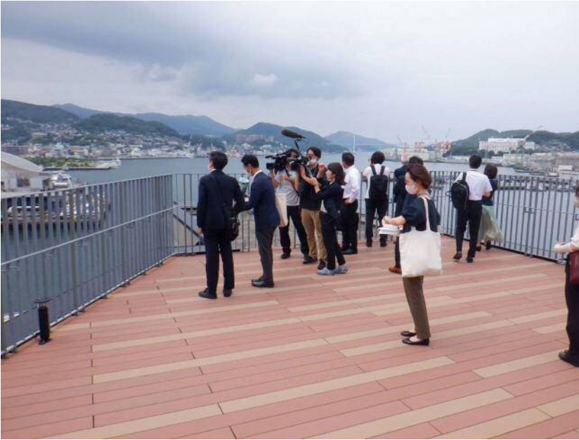
6/13長崎港 ⑦全体像の説明