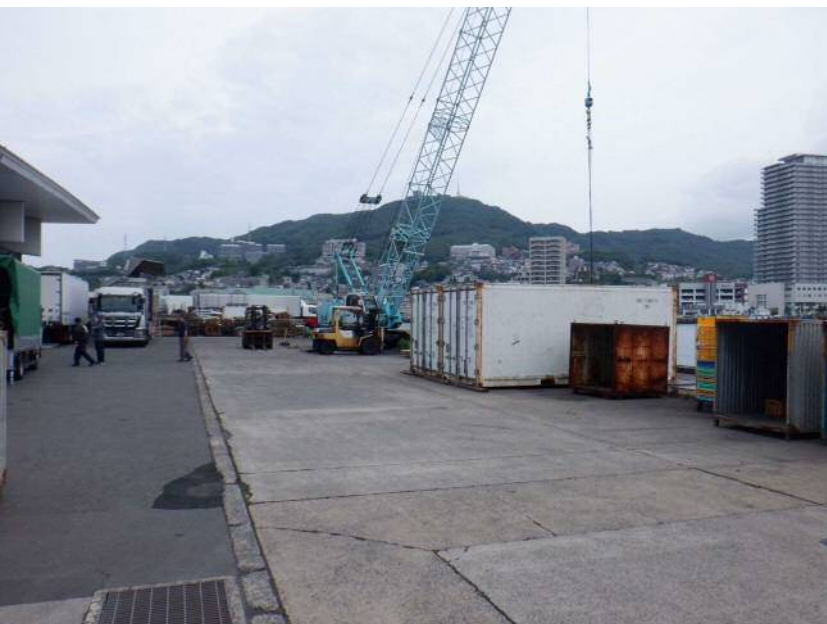
⑨【導入機能】 元船地区の荷さばきの状況