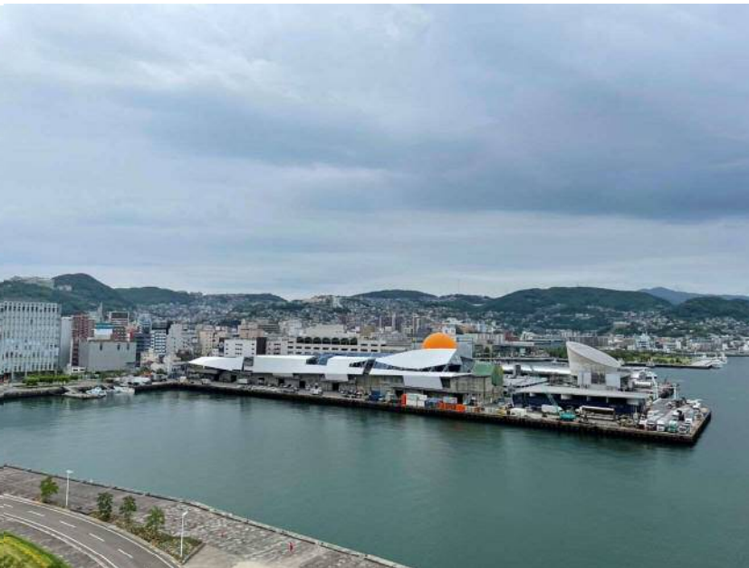
⑧手前:元船地区 中央:常磐・出島地区(未視察) 奥 :松が枝地区