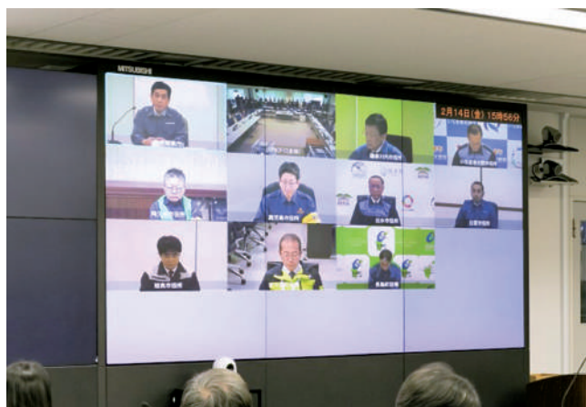
県災害対策本部会議