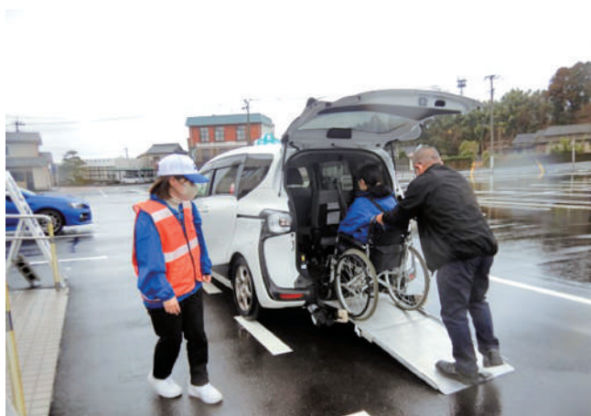
要配慮者対応（金峰文化センター）