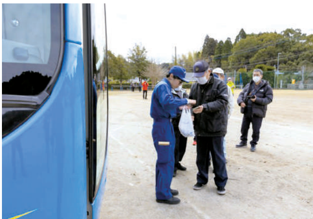
P A Z 住民避難（車両）