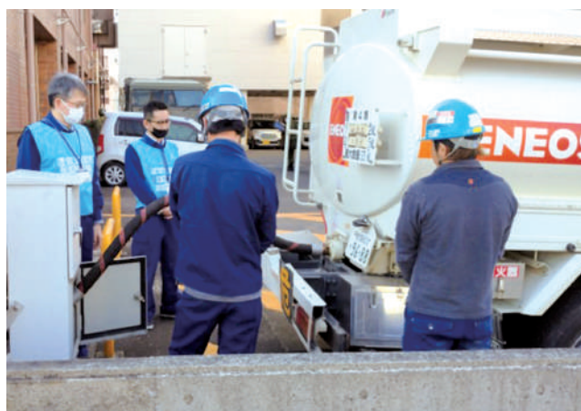
非常用発電機への燃料供給訓練