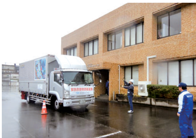
災害救援物資搬送（金峰文化センター）