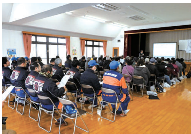
防災講習会（西目地区集会施設）