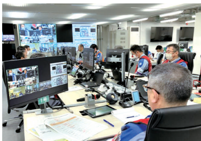
緊急時対策所（発電所内）