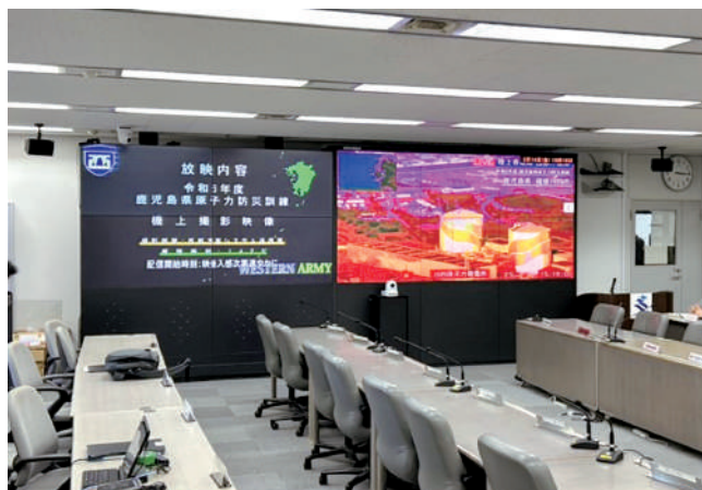
実動機関による映像伝送