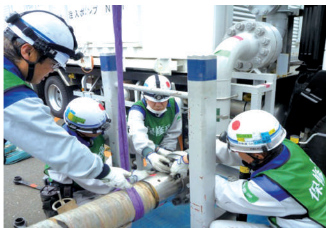
事故収束訓練（発電所内）