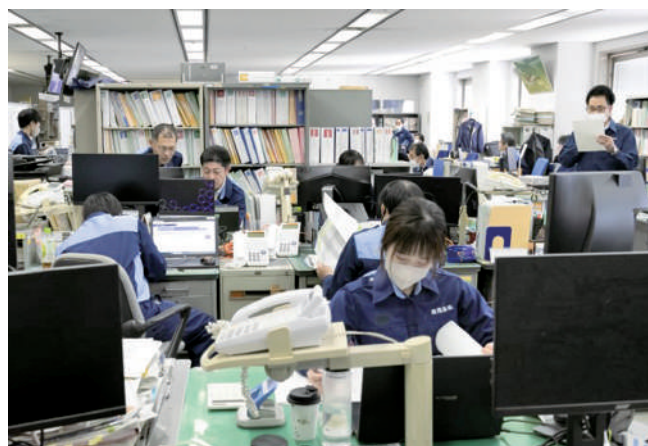
県災害対策本部運営