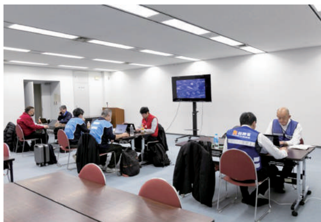
県災害対策本部運営（リエゾン）