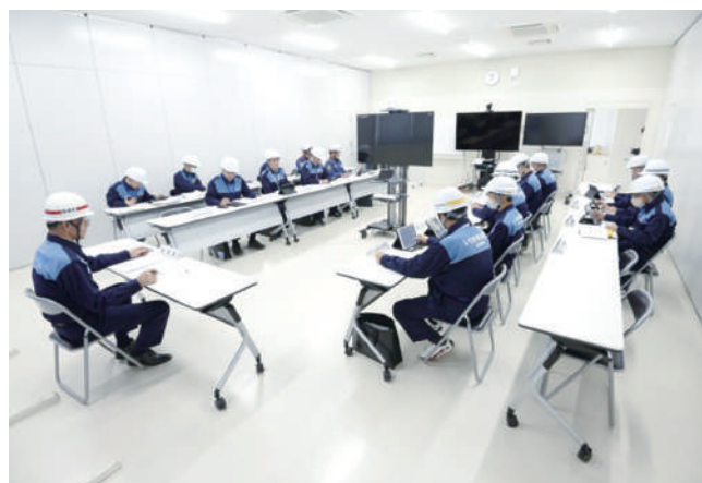
いちき串木野市災害対策本部会議