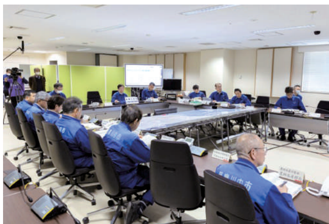
薩摩川内市災害対策本部会議