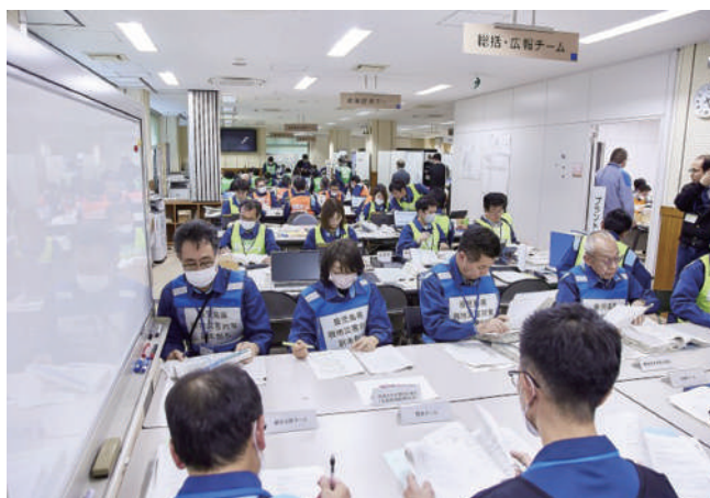
県現地災害対策本部