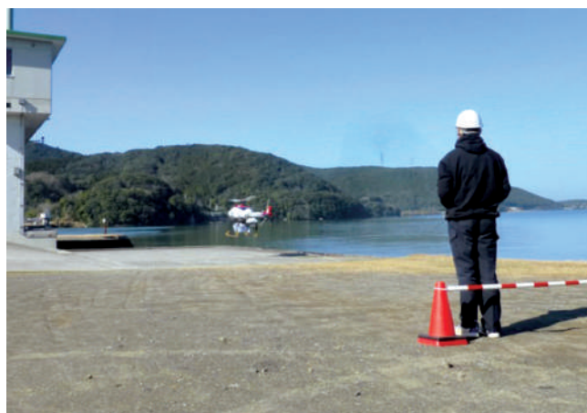
無人航空機モニタリング