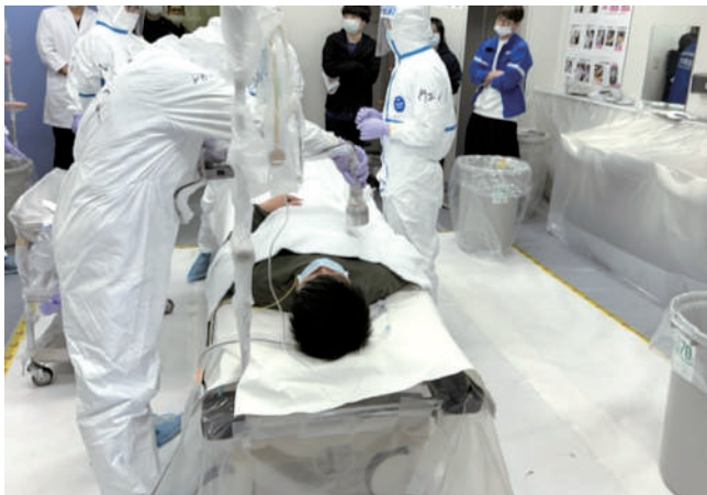
被ばく傷病者対応訓練