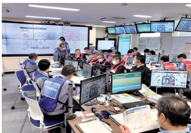
原子力施設事態即応センター（本店内）