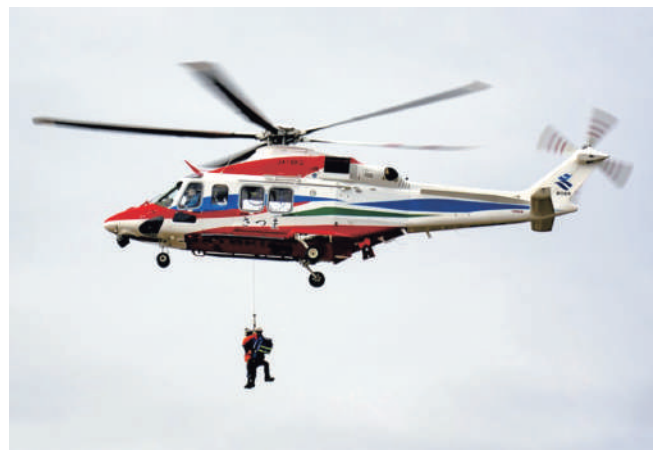
孤立を想定した救助訓練