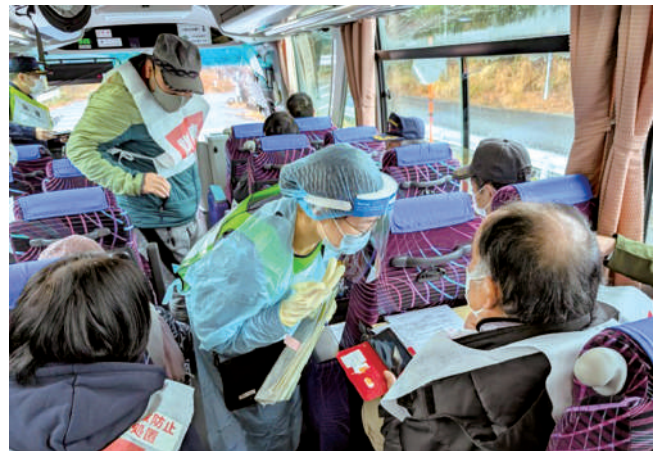
原子力防災アプリを使った 安定ヨウ素剤配布