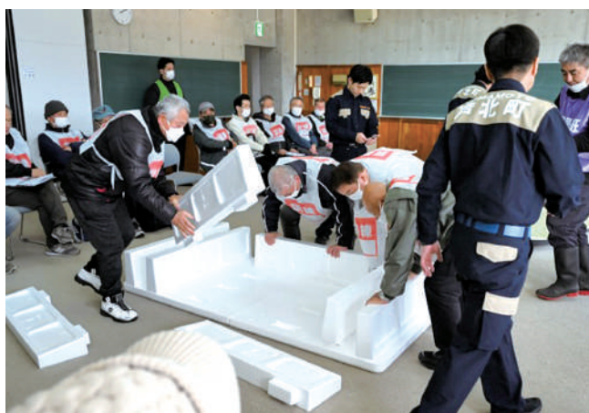
ベッド組立体験（熊本県立あしきた青少年の家）