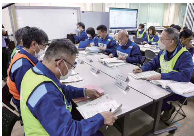
県現地災害対策本部会議