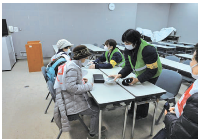
健康相談窓口（熊本県立あしきた青少年の家）