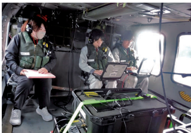
自衛隊ヘリによる航空機モニタリング