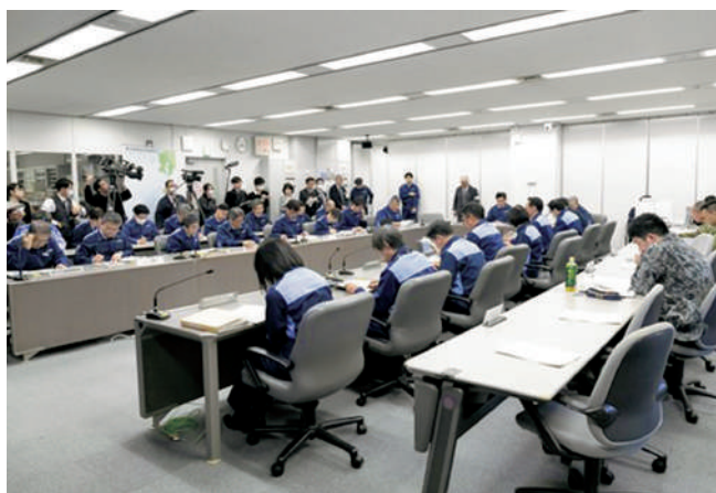
県災害対策本部会議