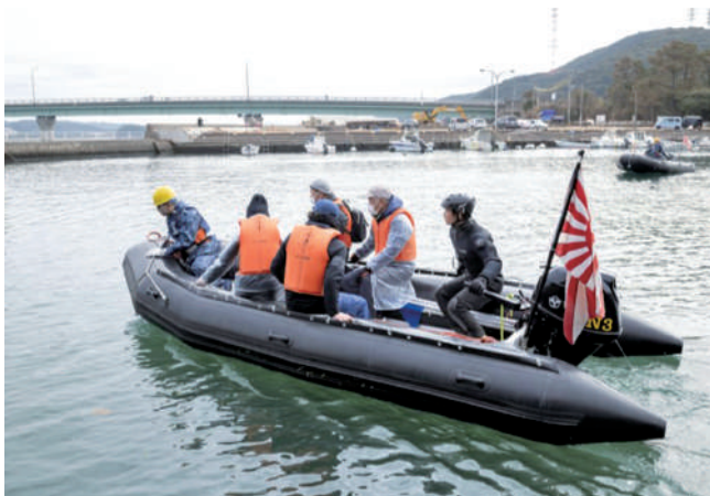
P A Z 住民避難（船舶）