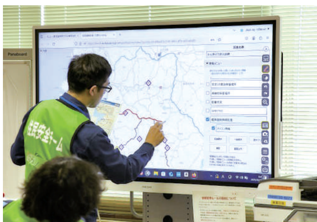
住民避難支援・円滑化システム