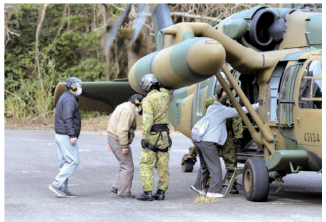
P A Z 住民避難（ヘリ）