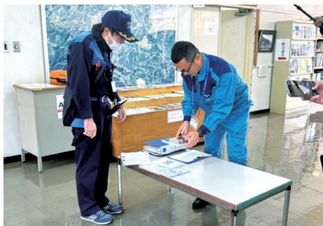
バスQRコードを用いた受付