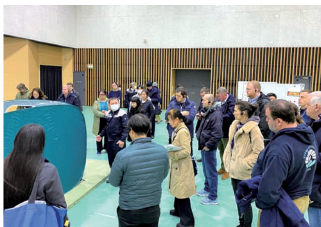
備蓄物資展示（始良高齢者福祉センター）