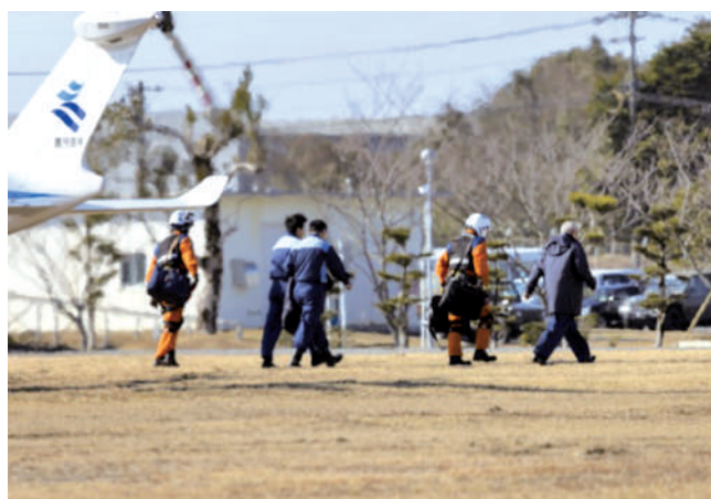
県防災ヘリによる搬送