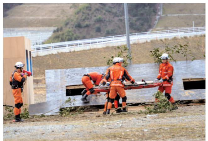
倒壊家屋からの救助