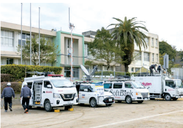
通信事業者による移動基地局車設置訓練