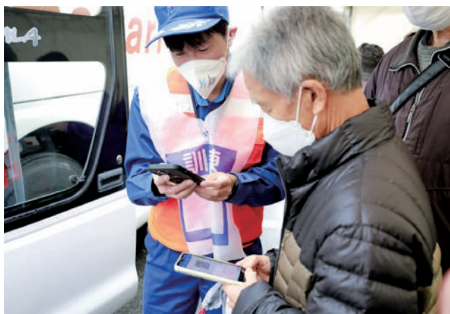
原子力防災アプリによる受付