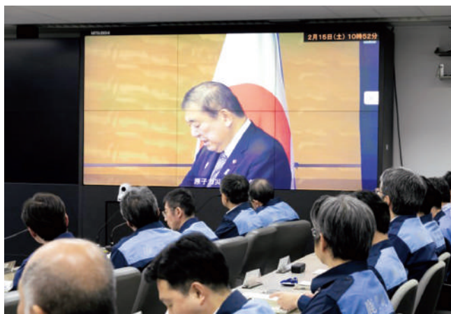
原子力緊急事態宣言