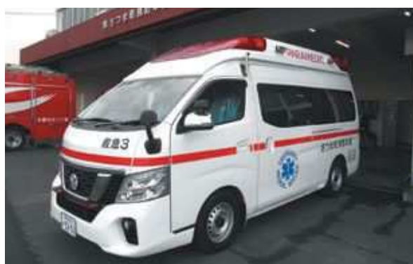
高規格救急自動車（さつま町）