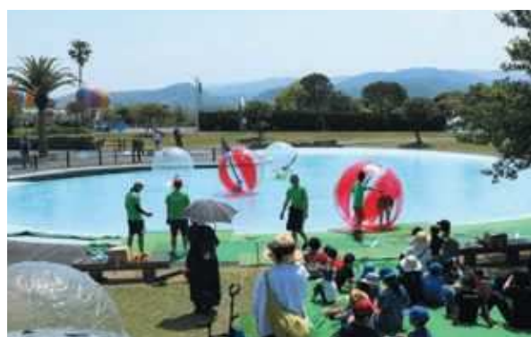
番所丘公園指定管理（阿久根市）