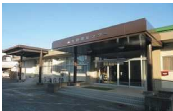
市来保健センター屋根防水改修（いちき串木野市）