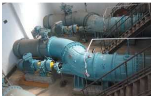
高江排水機場ポンプ改修（薩摩川内市）