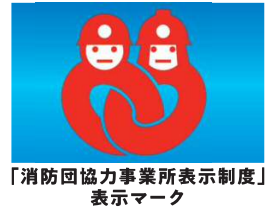
「消防団協力事業所表示制度」表示マーク

事業所が消防団に協力することは、地域への多大な社会貢献になります。本制度は消防団の活動に積極的に協力している事業所を「消防団協力事業所」として認定するものです。