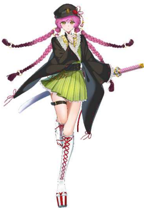
No. 59_椿 (照れ)