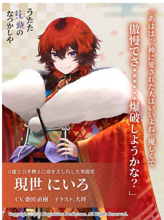
No. 77_紹介・現世にいろ