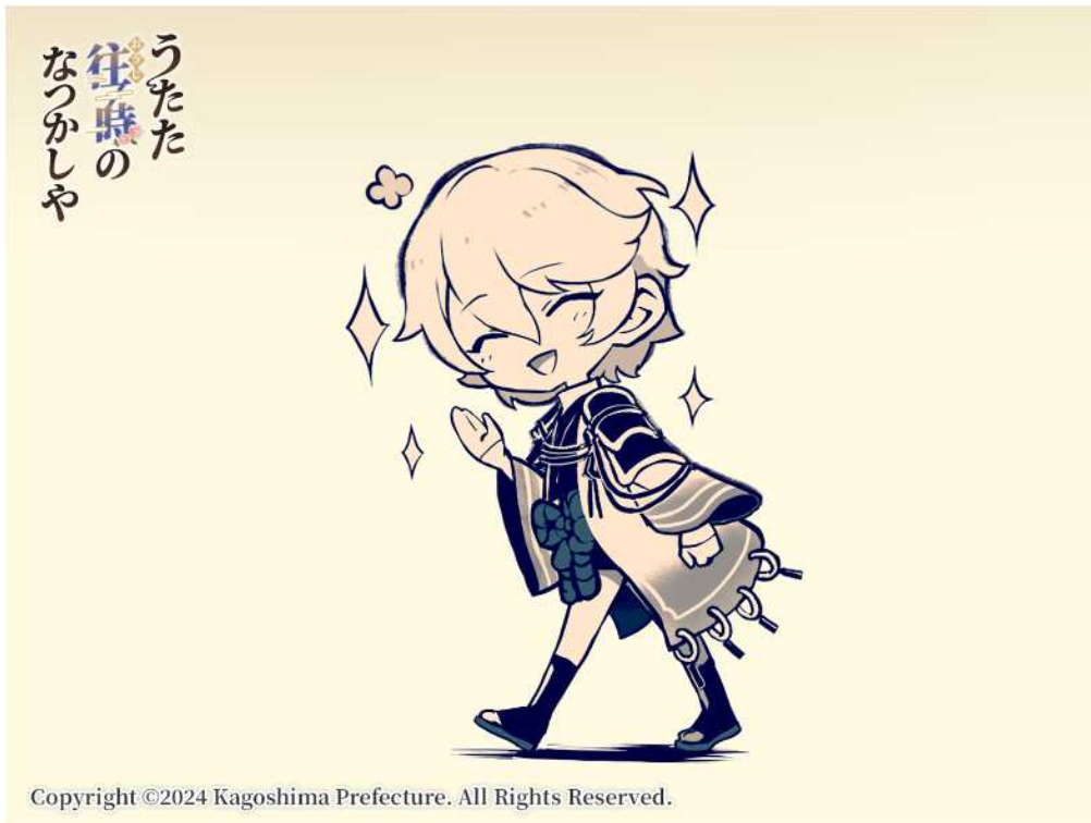
No. 94_デフォルメ・島津豊久と美男子