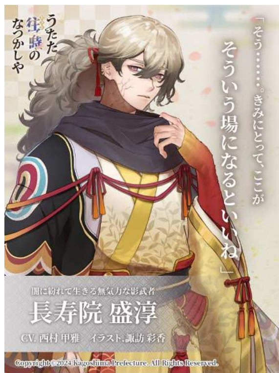
No. 70_紹介・長寿院盛淳