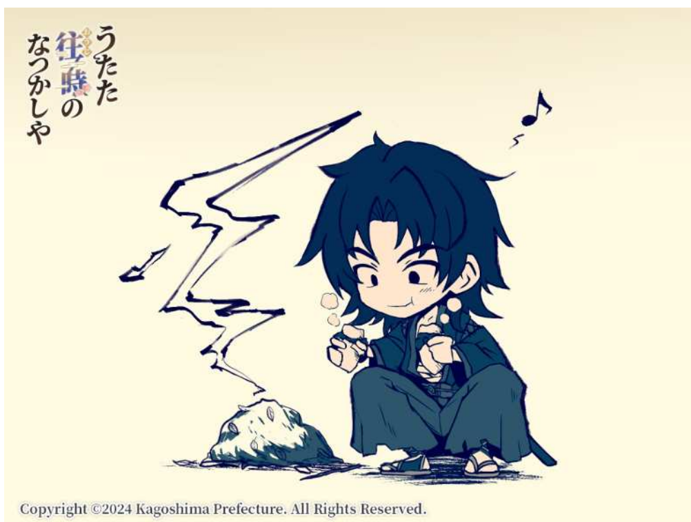
No. 95_デフォルメ・中馬重方とさつまいも