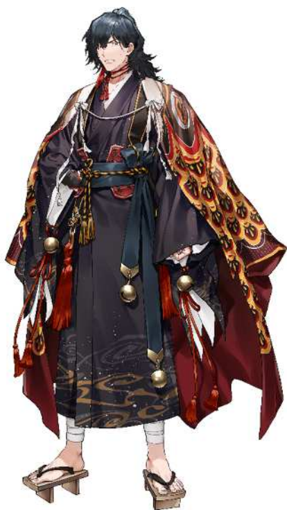
No. 7_島津義弘 (嫌そう)