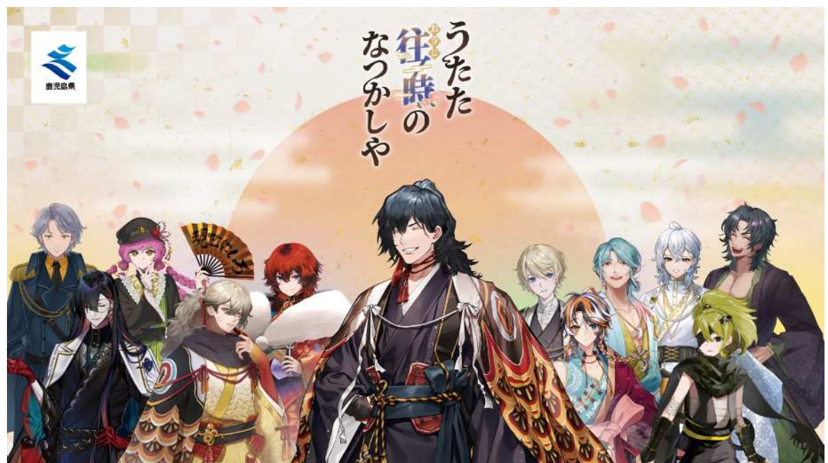
No. 2_全キャラクター集合 2