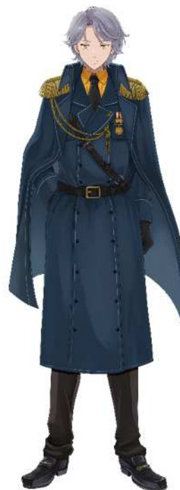
No. 62_天根山吹 (通常)