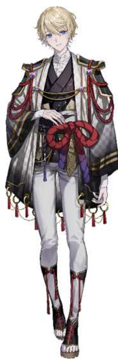
No. 8_島津豊久 (通常)