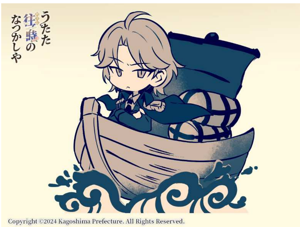
No. 93_デフォルメ・天根山吹と日本の貿易