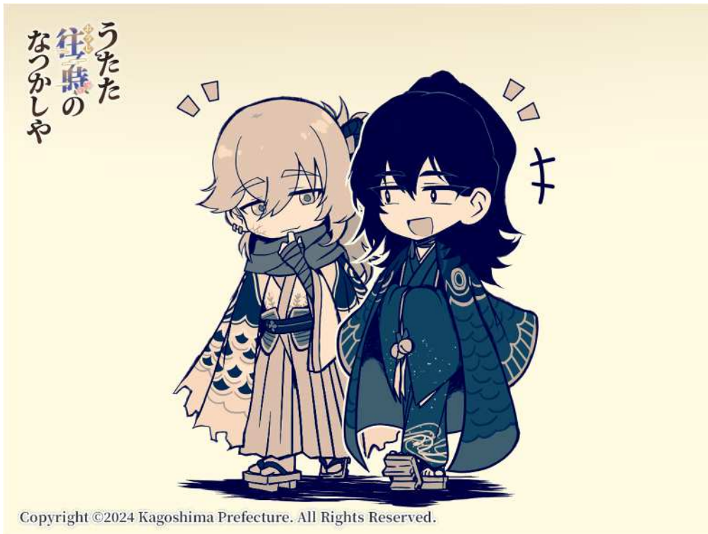
No. 90_デフォルメ・長寿院盛淳と島津義弘