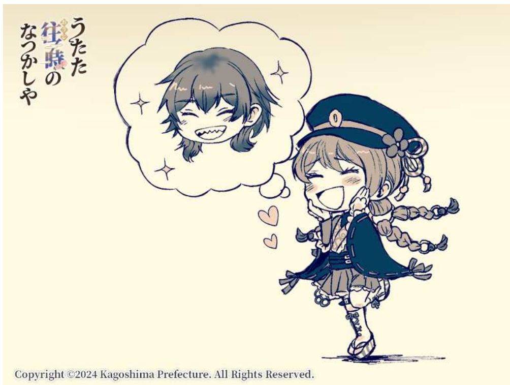
No. 81_デフォルメ・椿と恋人岬