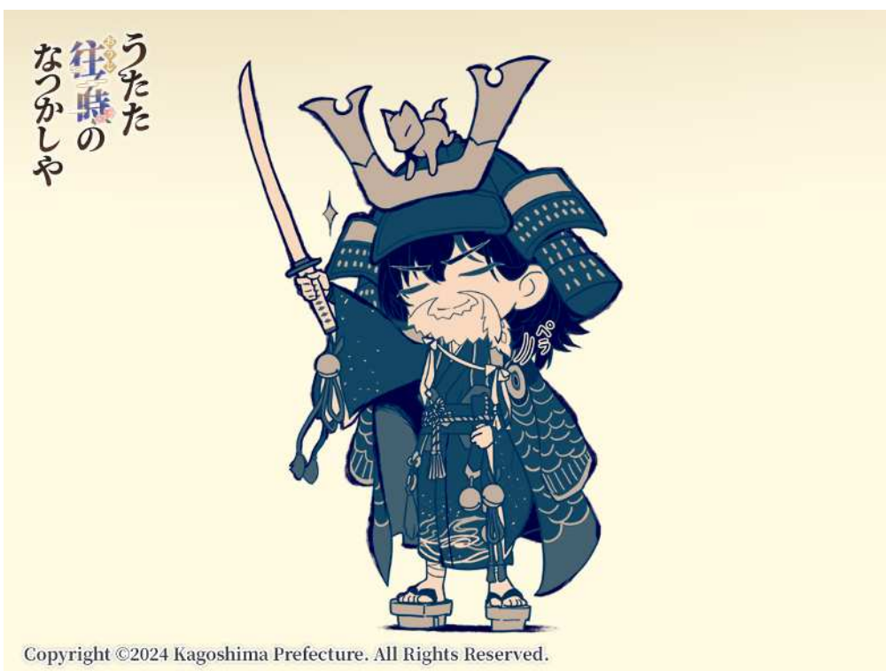
No. 83_デフォルメ・島津義弘とひげ