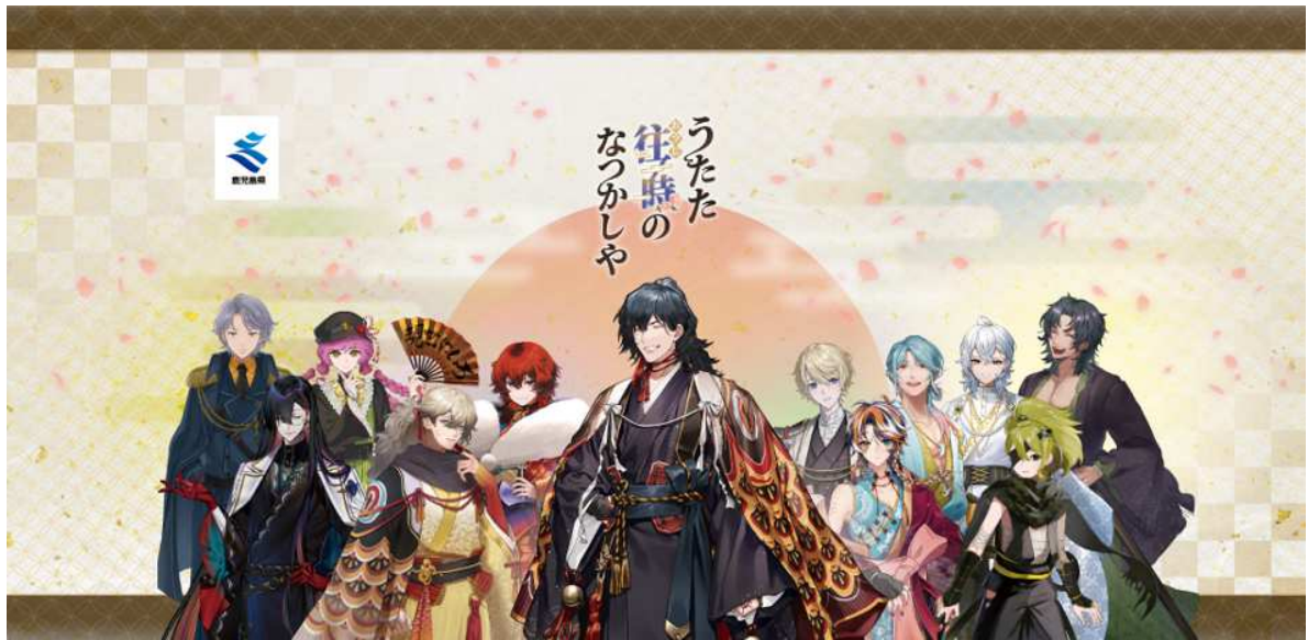
No. 1_全キャラクター集合 1