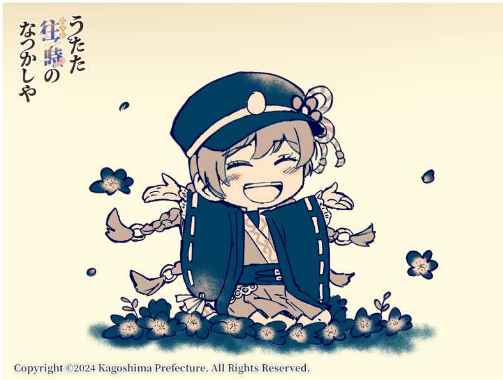
No. 98_デフォルメ・椿と慈眼寺公園