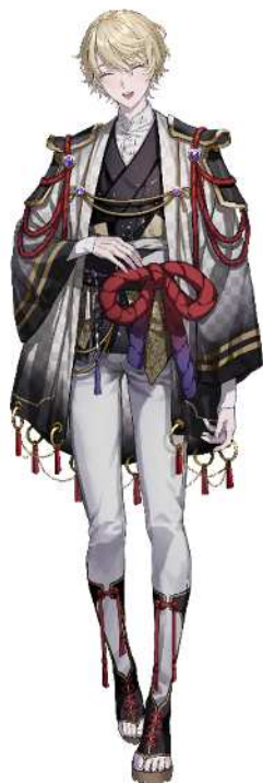
No. 9_島津豊久 (笑顔)