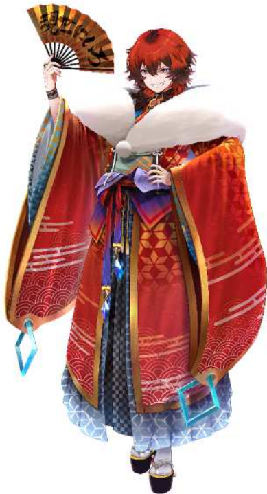
No. 53_現世にいろ(たくらむ)