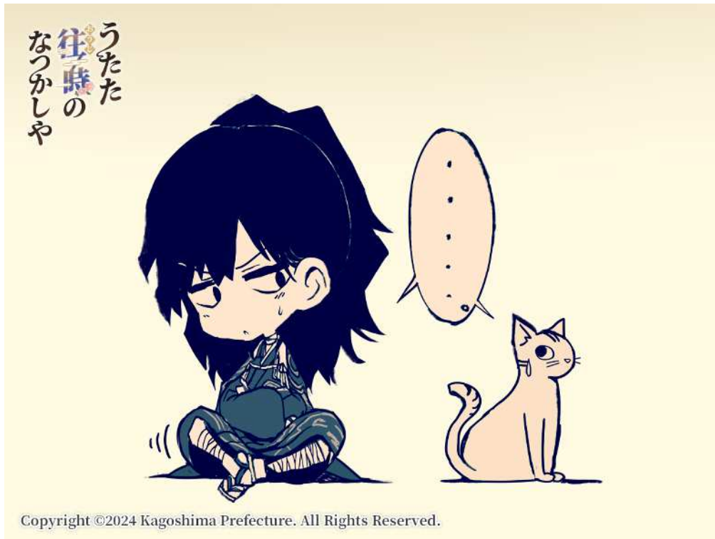
No. 80_デフォルメ・島津義弘と猫