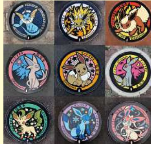
© 2022 Pokémon. © 1995-2022 Nintendo/Creatures Inc./GAME FREAK Inc. ポケットモンスター・ポケモン・Pokémonは任天堂・クリーチャーズ・ゲームフリークの登録商標です。