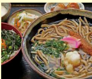
道の駅きんぼう木花館

TEL: 0993-77-3833 所在地: 南さつま市金峰町池辺1383 営業時間: 9時~18時(第2火曜休)