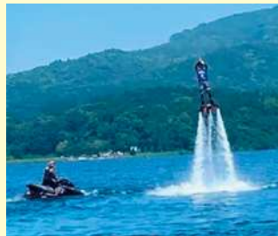
池田湖マリーナワルナ (WARNA) TEL: 0993-28-1696 所在地: 指宿市池田5123-4 営業時間: 10時~18時 (不定休)