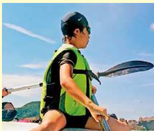
南さつま市教育委員会坊津教育課 TEL: 0993-67-0170 所在地: 南さつま市坊津町久志807-1 (現地) 営業時間: 9時~17時 (土・日曜休)