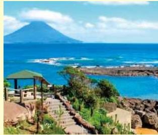
南九州市観光協会 TEL: 0993-58-7577 所在地: 南九州市額姓町別府 5202 (現地) 駐車場: あり