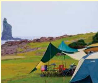
枕崎市役所水産商工課観光交流係 TEL: 0993-76-1668 所在地: 枕崎市火之神岬町 47 (現地) 駐車場: あり