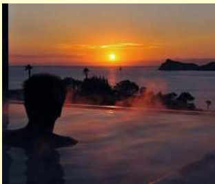
枕崎なぎさ温泉 TEL: 0993-72-5080 所在地: 枕崎市岩戸町217 営業時間: 12時~22時(不定休)