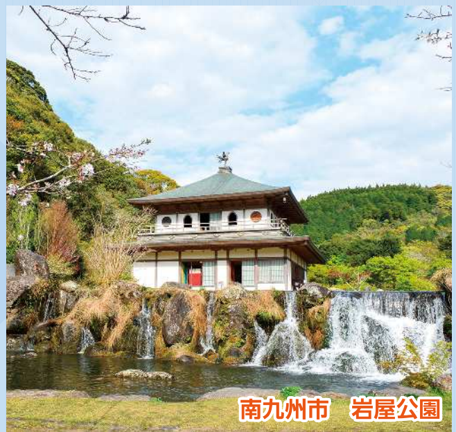
南九州市 岩屋公園