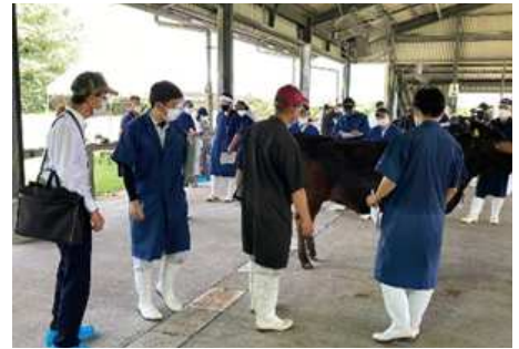
指宿地区2次予選会の様子