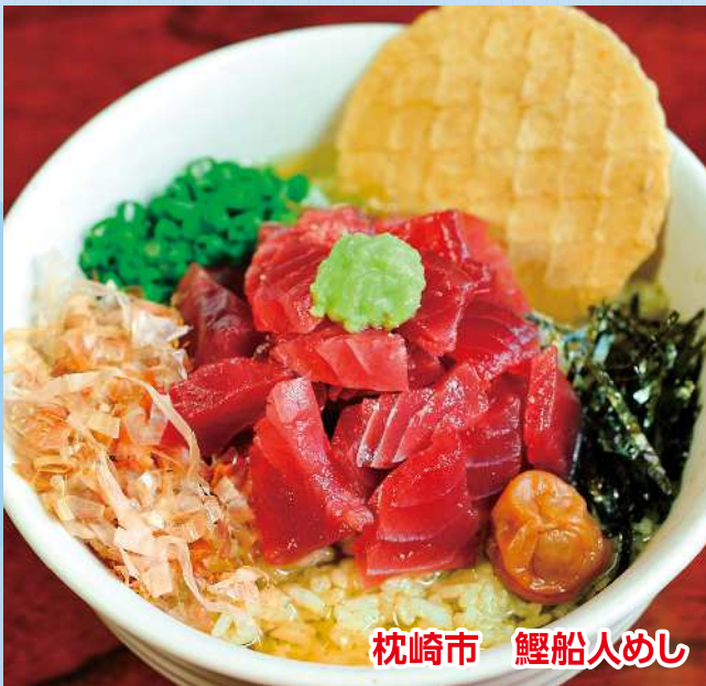
枕崎市 鯉船人めし