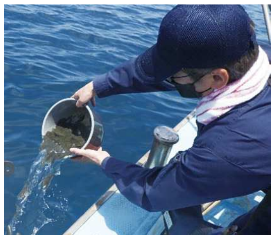
加世田沖での放流の様子