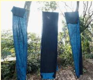
藍染屋 studio no4 TEL: 0993-78-2897 所在地: 南さつま市金峰町大坂7764-1 店休日: 無休 駐車場: あり