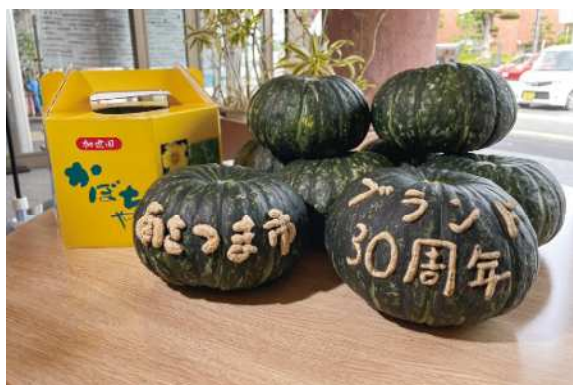
完熟した「加世田のかぼちゃ」