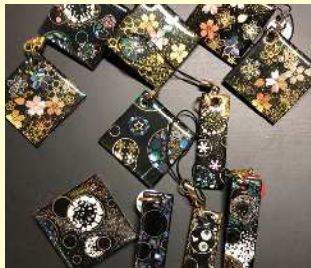
川辺仏壇工芸会館 TEL: 0993-56-0240 所在地: 南九州市川辺町平山6140-4 営業時間: 8時30分~17時(土日祝休)

【乗馬・お世話体験】 ●お世話体験: 3,300円 ●乗馬10分: 2,200円 (要予約)