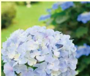
枕崎市役所建設課都市計画係 TEL: 0993-72-1111 所在地: 枕崎市豊留町 500 (現地) 駐車場: あり