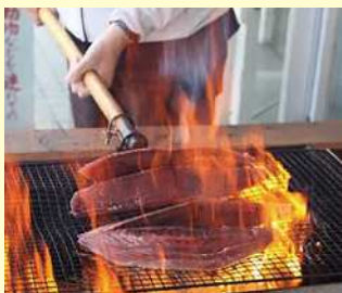
枕崎お魚センター

●所要時間: 30分~ 通常 スタッフによるご案内 11時、13時半、14時半~ ※現在新型コロナウイルス感染拡大を受け、中止とさせて頂いております。 ●入場料: 無料