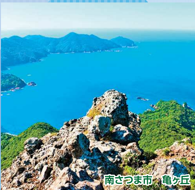
南さつま市 亀ヶ丘