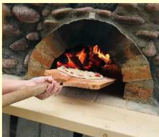
野生酵母&自然食カフェ ココカラ