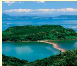
指宿市観光協会 TEL: 0993-22-3252 所在地: 指宿市西方 (現地)