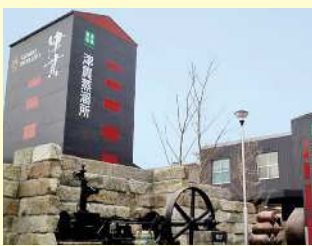
マルス津貫蒸溜所 TEL: 0993-55-2121 所在地: 南さつま市加世田津貫6594 営業時間: 9時~16時 ※休館日: 12/30~1/3*臨時休業あり 駐車場: 普通車22台 バス2台

【藍染体験】 ●ハンカチ染め2,200円 ●バンダナ染め2,750円 https://aizomeya.work/