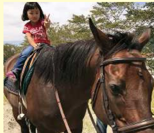
かなべ馬事公苑 TEL: 090-2391-1018 所在地: 南九州市川辺町野崎8152 受付: 9時~11時30分, 13時~15時30分(火曜日)