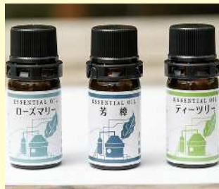
開間山麓香料園 TEL: 0993-32-3321 所在地: 指宿市開間川尻5926 営業時間: 9時~17時 (火曜日【祝除く】)

ポケモン「イーブイ」と、その進化形のポケモンたちのマンホールを指宿市内9カ所に設置しています。 イーブイは、指宿駅前隣の交番前で見つけられます。 是非、9種類すべて見つけてみてください!