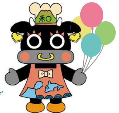
大会マスコットキャラクター「かごうしママ」