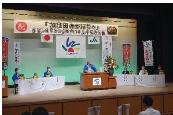
かごしまブランド指定30周年記念大会の様子