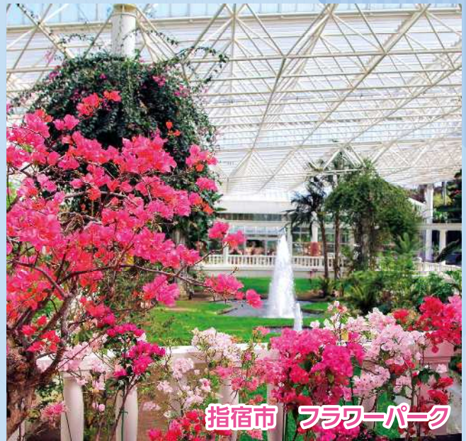
指宿市 フラワーパーク