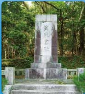
2 笠狭宮址(カササノミヤト) 【南さつま市加世田】 ヒコホノニギノミコトとコノハナサクヤヒメがお住まいになったとされる場所