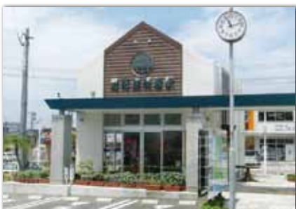
枕崎駅前観光案内所

土日祝日には観光ボランティアガイドの面々が駅ホームにて皆様のお越しをお待ちしています。