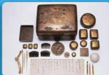
7 玉手箱(枚間神社)【指宿市開聞町】