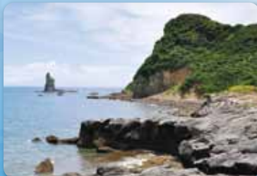
3 火之神(火之神公園)【枕崎市】 山幸彦が紛失した釣り針を最初に探しに行ったとされる場所