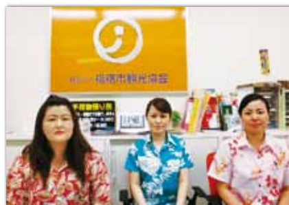
指宿駅観光案内所の皆さん

砂蒸し温泉に関するおたずねが多いですが、知林ヶ島や竜宮神社については、若いお客様を中心に問い合わせが増えています。