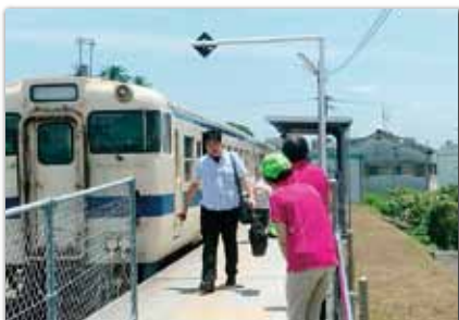
駅での出迎えの様子