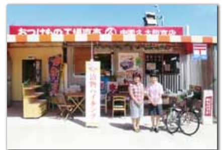
西大山駅観光案内所

最南端のJR駅ということもあり、県内外からたくさんの観光客の方が訪れており、この方々とのふれあいを通して、メル友になったり、お礼のお手紙をいただいたりと元気をもらっています。