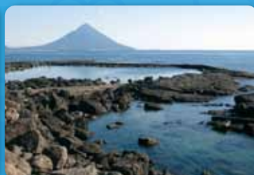
6 番所鼻【南九州市穎娃町】 竜宮城への入り口があるという言い伝えがある場所