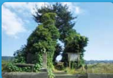
4 玉乃井【指宿市開聞町】 山幸彦とトヨタマヒメが会ったとされる場所