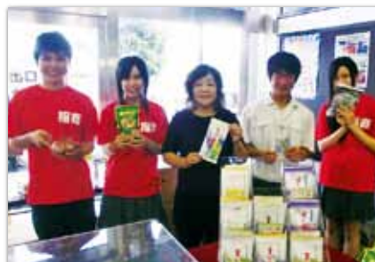
指宿駅でお茶のサービスを行っている指宿商業高等学校の皆さん