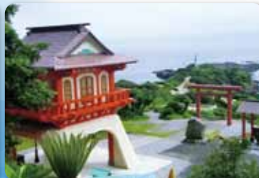
5 長崎鼻(竜宮神社)【指宿市山川町】 浦島太郎が竜宮へ旅立ったとされる岬