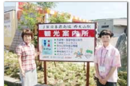
観光案内所看板の前にて