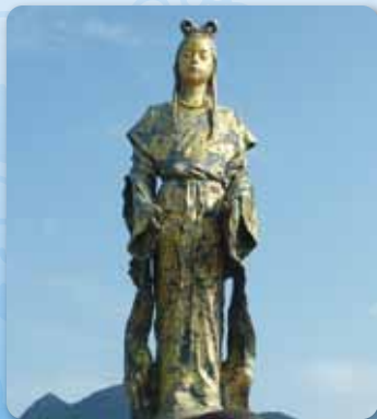
1 木花咲耶姫(コノハナサクヤヒメ) 銅像(木花館)【南さつま市金峰町】

以来、南薩地域の海岸には、たくさんのウミガメが上陸するようになったといわれています。」とき。