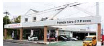
Honda Cars さつま 隈之城店