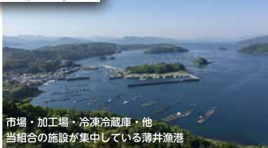
市場・加工場・冷凍冷蔵庫・他 当組合の施設が集中している薄井漁港