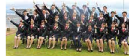
2020年4月入庫 新入職員

当金庫に入庫する際は、特別必要な資格はありませんが、入庫してからは、金融に関する資格をはじめ、数多くの資格取得にチャレンジしていただきます！