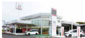
Honda Cars さつま 阿久根店

「お客様から「ありがとう」のお言葉をいただくために」働くことは、お客様から「ありがとう」のお言葉を頂戴すること。そのために取り組んでいるのは「連携の良いチーム作り」。Hondaには「ホンダフレッシュサークル」という、お客様の満足に繋がる活動を基盤に、自己啓発や、職場の問題解決・課題達成といった相互啓発を社員みんなで取り組む活動を行っています。それぞれの守備範囲をしっかりと守り、お互いが助け合い支え合いながら、チームの力を最大化させる。HondaCars さつまでは“チーム力”を大事にしております。