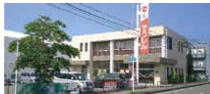
鹿児島相互信用金庫 阿久根支店