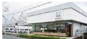
Honda Cars さつま 上川内店