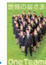
2020年4月入庫 新入職員ポスター

お客さまのために何ができるか、どのようにしたら喜んでいただけるかを常に考え、地域に貢献したいという気持ちを持っている方！“そうしん”で、ぜひ一緒に働きましょう。