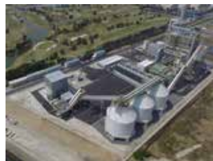
(写真左) バイオマス発電設備 マテハンタンク据付工事