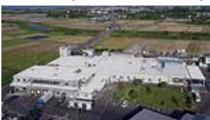
野田工場（ブロイラー処理場）