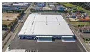
GPセンター（鶏卵処理場）