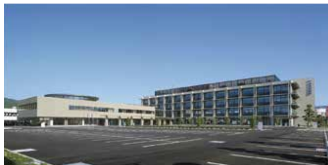
施工事例：出水市新市庁舎建築工事 (2016)