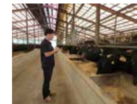
牛の状態をチェック！