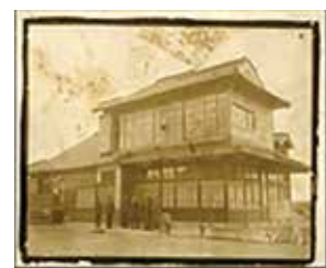
昭和4年(1929年) 創業当時