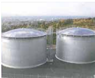
大型タンク、左力容器、配管、機器据付等様々なジャンルに対応しております。