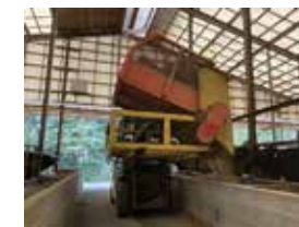
機械を使って効率化