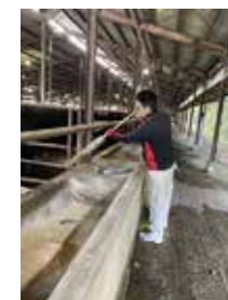
飼槽はいつも綺麗に！