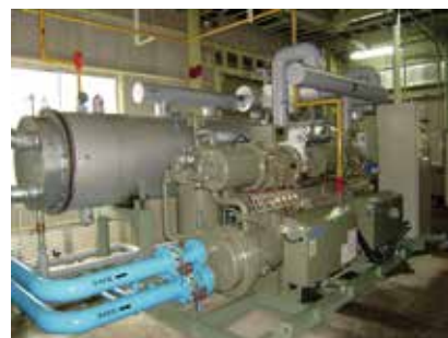
冷凍機・チラー設備の導入事例