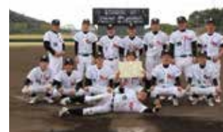
農協グループの軟式野球部 2018年「西日本軟式野大会」 ベスト8!