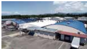
高尾野工場（加工食品工場）