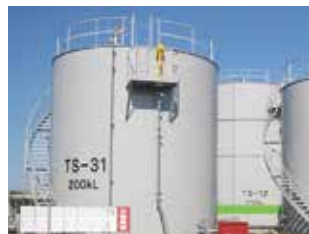
(写真右) 200KL アルコールタンク 貯槽新設工事