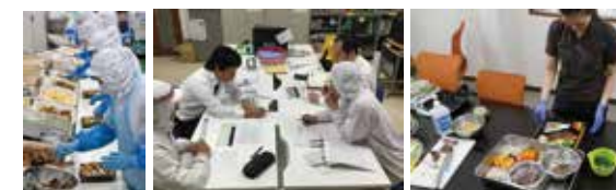
【製造風景】 【社長と打ち合わせ】 【商品開発】

※製造数量次第では深夜作業有り(深夜手当が付きます) 営業職も事務職も、まずは製造現場を経験して頂きます。