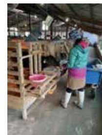
子牛への哺乳作業

7:40 朝礼 8:00 始業 12:00 昼休憩 14:00 午後の作業開始 17:00 終業、退社