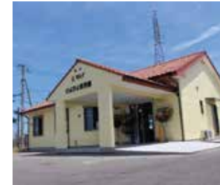
マルイぴよぴよ保育園