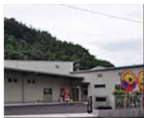
平成25年(2013年) 本社・新工場設立