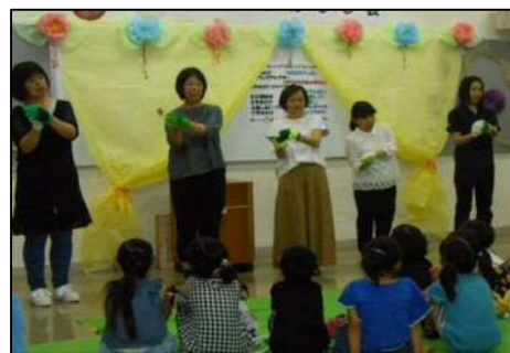
学校司書によるわらべうた♪