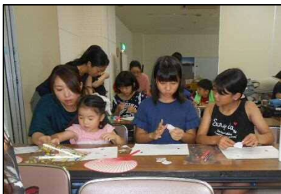
工作・うちわ作り

時が過ぎ、年度末に保護者の方から嬉しいお話が聞けました。「あの夏の読み聞かせ体験から少し子どもが変化したような気がします。人前で発表したことで、自分に自信がついた様子・・・」とのことでした。「おはなし会に参加したことが、子どもたちの『成長のきっかけ』となった」というとても嬉しい報告でした。