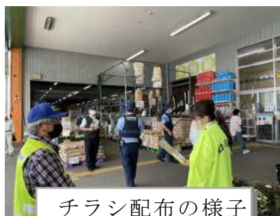
チラシ配布の様子

鹿児島県と鹿児島県警は「鹿児島県犯罪のない安全で安心なまちづくり県民会議」で10月11日～10月20日までを旬間として、県内各地で防犯教室等を実施しました。今回は「子ども・女性・高齢者の犯罪被害防止」「うそ電話詐欺（特殊詐欺）被害の防止」「防犯意識の醸成と環境づくりによる犯罪被害の防止」を中心に、スーパー店頭で地元警察署員、防犯組合の方々の協力をいただき、チラシを配布する活動を行いました。