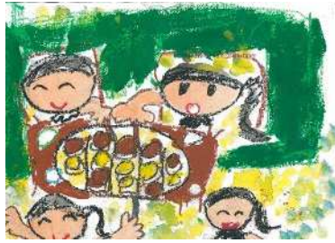
「たこやきやくの わたしに まかせて」 霧島市立国分小2年 浅野春花