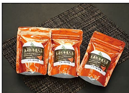
食品部門最優秀賞 「生姜紅茶屋久島」