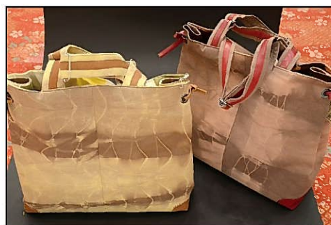
工芸品部門最優秀賞 「砂鉄染トートバッグ」