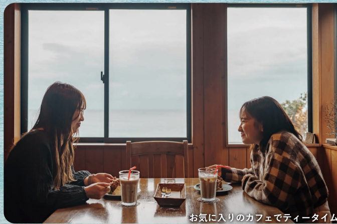
お気に入りのカフェでティータイム

当院では各部署に応じた勉強会や研修会を頻繁に行うなど、教育体制に力を入れております。新卒の二人が入ったことで、私たちが学び直すきっかけとなり良い刺激を受けております。これからの種子島の医療を支えていく人材として非常に期待しております。