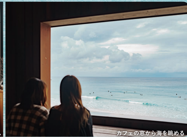
カフェの窓から海を眺める