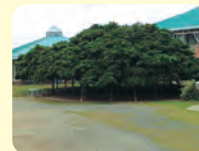
沖永良部のガジュマル (枝張り22.5mで日本一)