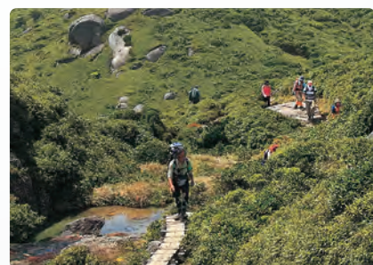
トレッキングの様子(屋久島町)