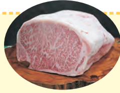
全国和牛能力共進会 チャンピオン牛 (第9区(去勢, 肥育))肉