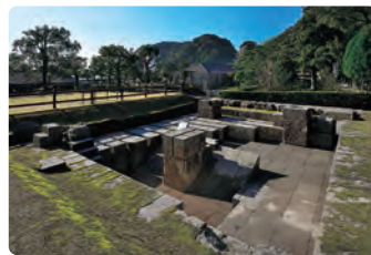
旧集成館(反射炉跡)

旧集成館、寺山炭窯跡、関吉の疎水溝は、幕末から明治期の重工業における急速な産業化の道程を証言する産業遺産群の構成資産であり、九州・山口を中心とする8県11市の23の資産で構成される世界文化遺産として、2015年7月に登録されました。