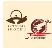
焼酎ブランド マーク