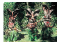
悪石島のボゼ (十島村)