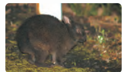
アマミノクロウサギ