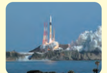
種子島宇宙センター