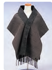
大島綿を使用した カシミアストール