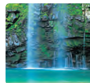
雄川の滝 (南大隅町)