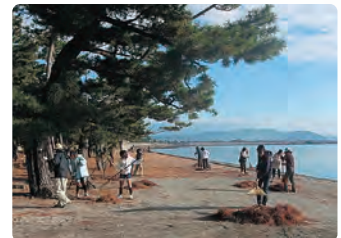
重富海岸の清掃イベントの様子