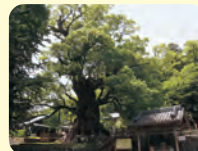
蒲生の大楠 (根回り33mの 日本一大きな木)