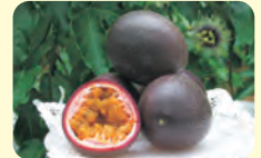
パッションフルーツ