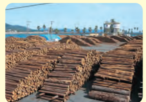
志布志港野積場の木材