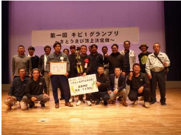
第一回 キビ1グランプリ（令和5年11月16日，奄美市）