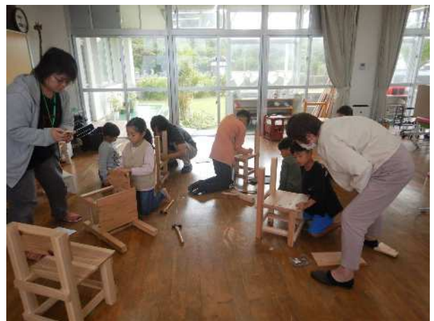
森林とのふれあい推進事業 ～木工体験教室～