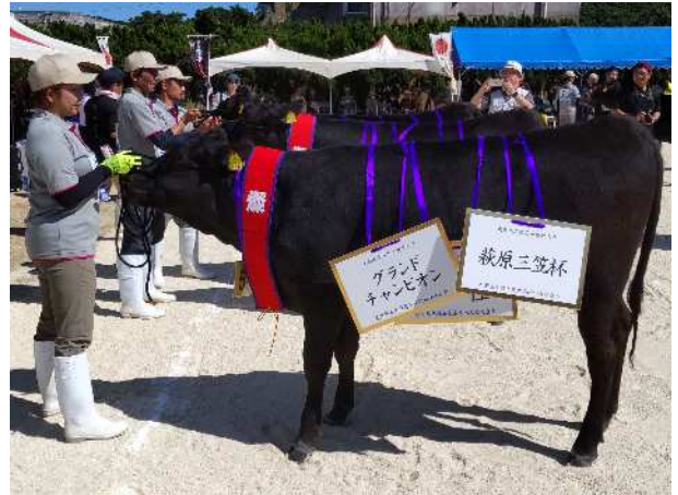
大島地区肉用牛振興大会（令和5年10月18日・19日，和泊町）