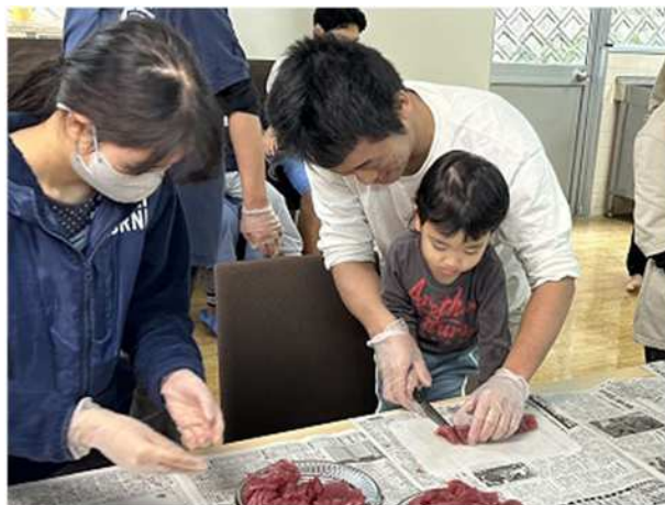
魚食普及活動 ～魚さばき教室～