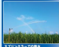
スプリンクラーでの散水