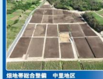
畑地帯総合整備 中里地区