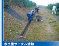
水土里サークル活動