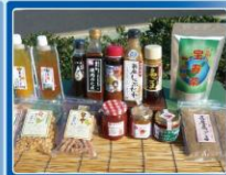
特産品を使った加工品