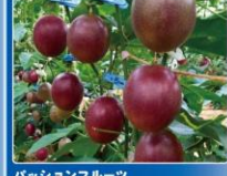
パッションフルーツ