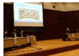
【県健康教育研究大会がん教育分科会】