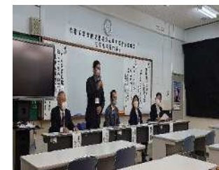
【曽於高校授業研究】