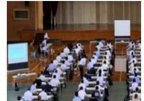
【県高等学校・特別支援学校体育担当者研修会】