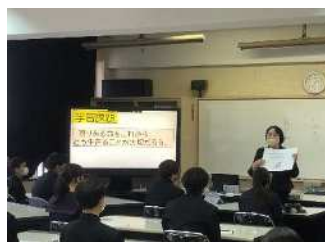
【清水中学校公開授業】

学校名 鹿児島市立清水中学校 公開授業期日 令和5年1月24日 実施教科 第2学年「道徳」 実施内容 がん経験者を講師とした 公開授業及び授業研究 参加者対象(数) 鹿児島市内中学校教職員 (39人)