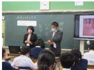
【宇宿小学校公開授業】

学校名 鹿児島市立宇宿小学校 公開授業期日 令和4年11月17日 実施教科 第6学年「学級活動」 実施内容 がん経験者を講師とした 公開授業及び授業研究 参加者対象(数) 鹿児島市内小学校教職員 (56人)