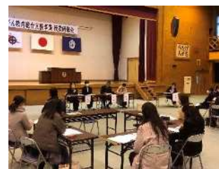
【清水中学校授業研究】