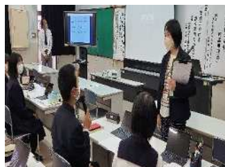
【曽於高校公開授業】

学校名 県立曽於高等学校 公開授業期日 令和4年11月11日 実施教科 第2学年「保健体育科」 実施内容 がん経験者を講師とした 公開授業及び授業研究, 医療関係者による講演会 参加者対象(数) 大隅地区内小・中・高等 学校教職員(49人)