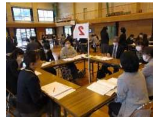
【宇宿小学校授業研究】