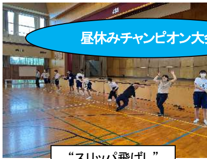
昼休みチャンピオン大会