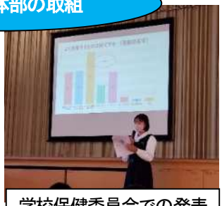
学校保健委員会での発表