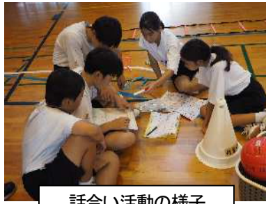
話し合い活動の様子