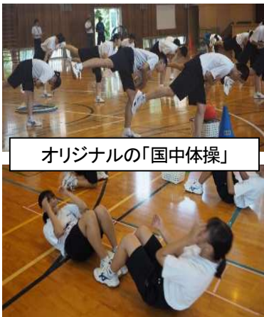
オリジナルの「国中体操」