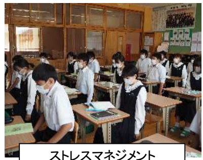
ストレスマネジメント