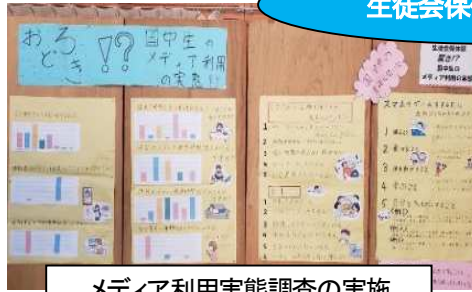
メディア利用実態調査の実施