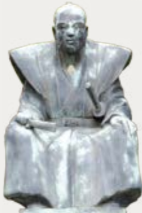
財政改革の責任者 調所広郷

当時の薩摩藩は、幕府に命じられた木曾川治水工事、島津重豪の開明化政策などに費用がかさみ、破綻の危機にあった。砂糖が高価な時代、黒糖は薩摩藩にとって効率のよい換金作物だったため、財政改革のひとつとして奄美の砂糖の専売制の強化を行った。これは奄美の人々に大きな負担をかけたが、この財政改革の成功が、のちの集成館事業や明治維新を推進する資金になった。