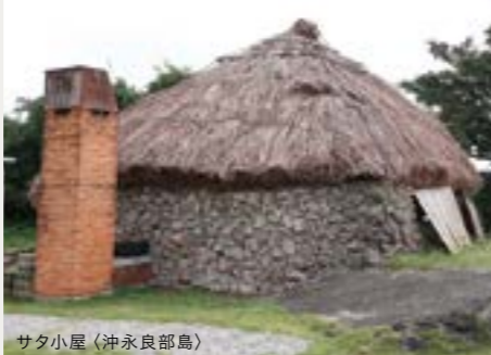
サタ小屋(沖永良部島)