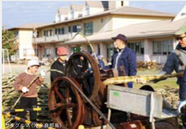
サタグルマ(沖永良部島)