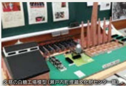
久慈の白糖工場模型(瀬戸内町埋蔵文化財センター蔵)

〈江戸～明治時代:奄美産の白糖〉 白糖の作り方は寛文2年(1662)に中国から沖縄へ伝えられており、奄美でも明和4年(1767)以前には白糖が作られていた。 慶応から明治初期にかけて、奄美大島に4つの西洋式機械制白糖工場が作られたが、大量に必要な薪の供給体制を確立できなかったこと、暴風による工場倒壊などが重なり、廃止となった。建物に使われていた切石は民家や奄美市立名瀬小学校の石段等に転用されている。 〈昭和中期:白糖の原料づくり〉 戦後、日本は白糖の大半を輸入に頼っていたが、昭和34年に農林省が策定した「国内甘味資源の自給力強化総合対策」により、白糖の製造が推進された。この頃、薩南諸島では集落ごとの伝統的な黒糖製造から、大規模工場による「原料糖」の製造に切り替える工場が多数あったという。