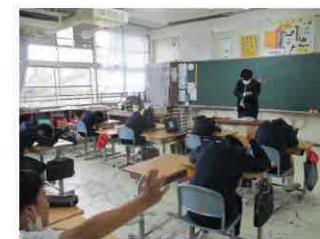
【弁護士によるいじめ防止授業】