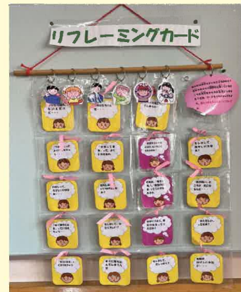
（南さつま市立大笠中学校）