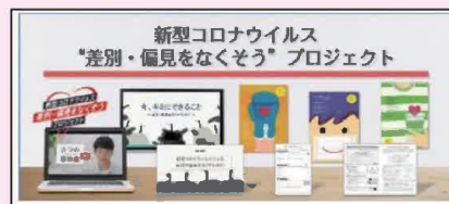
文部科学省新型コロナウイルス感染症に係る啓発動画