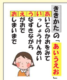
(いちき串木野市立照島小学校)