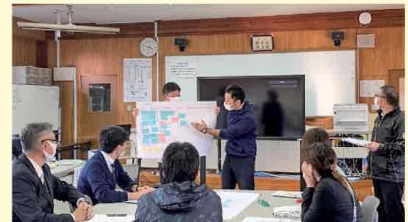
（南大隅町立第一佐多中学校）