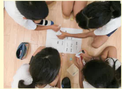
（南種子町立西野小学校）