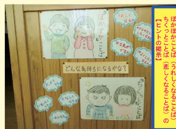
(霧島市立向花小学校)