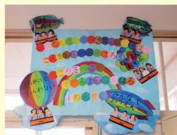
(出水市立大川内小学校)