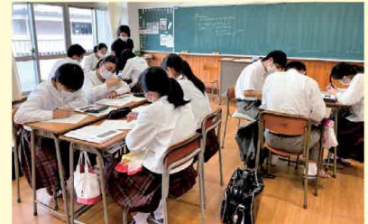
（県立奄美高等学校）