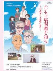
厚生労働省パンフレット 法務省人権啓発動画

過去にハンセン病患者等に対するいわれのない差別や偏見が存在したという事実を重く受け止め，これを教訓として今後に生かすことが必要です。