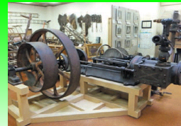
曾於市 磯集成館製の蒸気機関