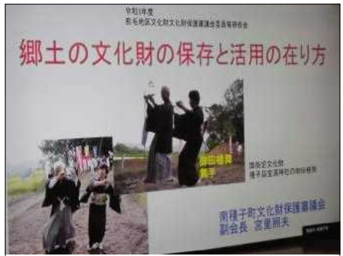
事例発表（南種子町）の様子 「郷土の文化財の保存と活用の在り方」