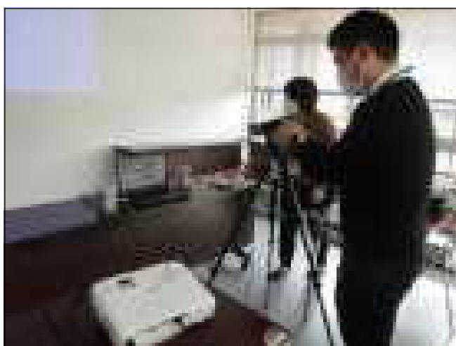
研修会を記録する様子