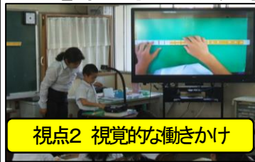
視点2 視覚的な働きかけ