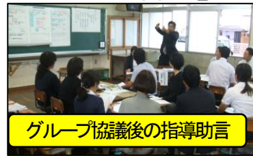
グループ協議後の指導助言