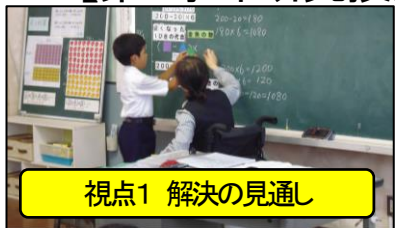
視点1 解決の見通し