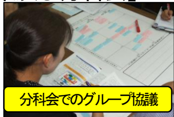
分科会でのグループ協議