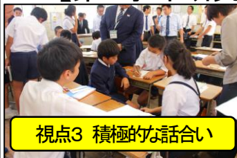
視点3 積極的な話し合い