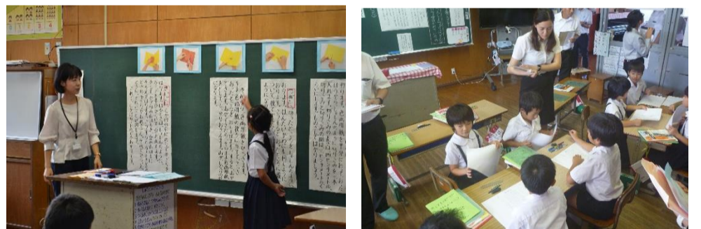
2年「説明の仕方に気を付けて読み、わかりやすく説明しよう」(3/11)