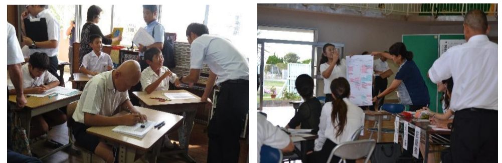
6年「筆者のものの見方をとらえ、自分の考えをまとめよう」(4/12)