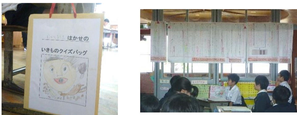
単元を見通した言語活動