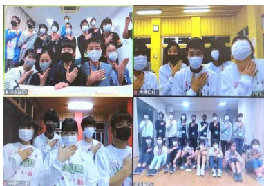
【和泊町】わらんちやヤンバル体験交流プロジェクト