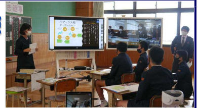
[徳之島町立母間小学校での公開授業]

今年度は、以下の学校が時代の要請や学校の実態等を踏まえながら研究を深め、その成果を公開しました。概要は、大島教育事務所のホームページに掲載していますので、ぜひ、各学校の今後の取組の参考にしていただければ幸いです。