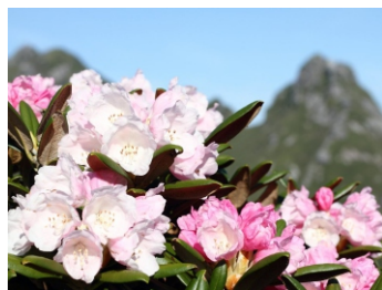
ヤクシマシャクナゲ